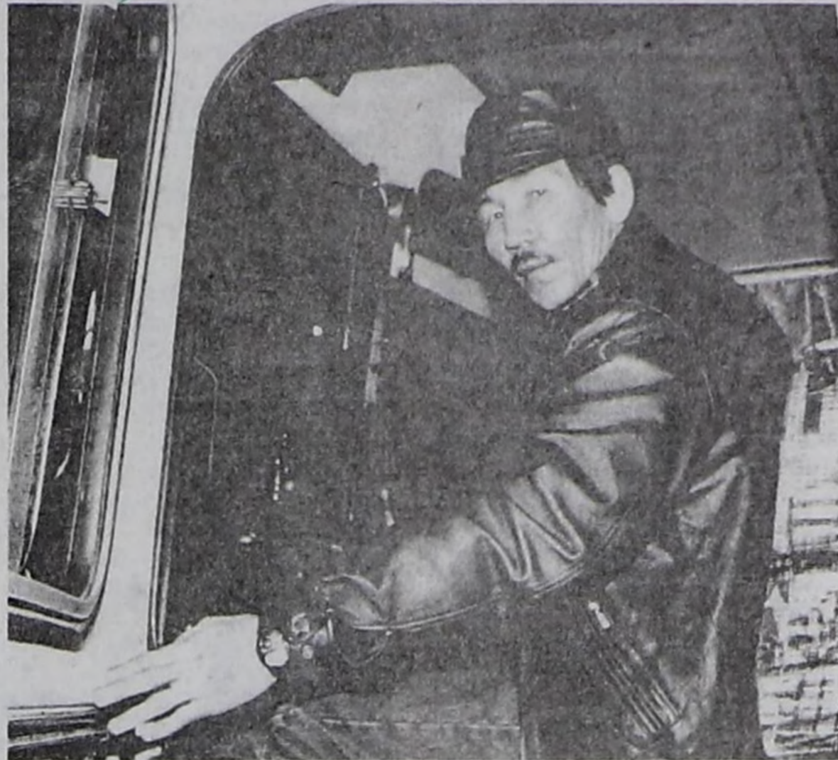
Ажылдалга кирер тудугда