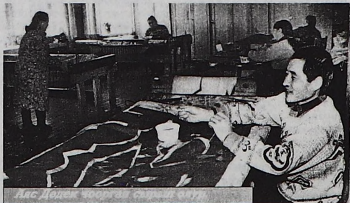
Аяс Дөдек чоорган сыртыктарны