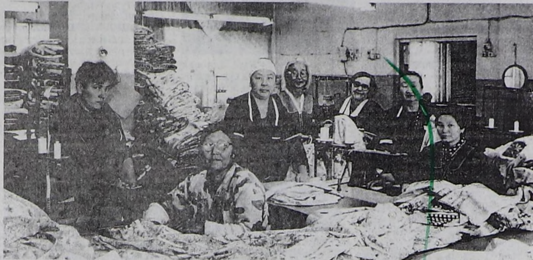
Чоорган, сырткы хаптары даараар цехтин ажылчыннары.

— Удавас РФ-тиң Күрүне Думазынче депутаттар сонгуур бис. Бистиң эге организациявыска