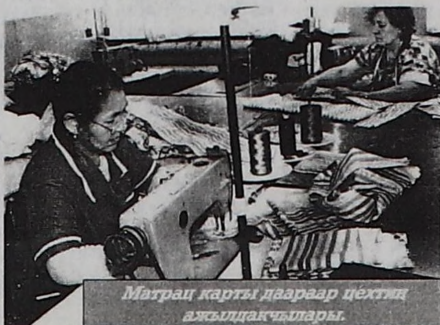
Матрац карты даараар цехтеги ажилдакчылары.