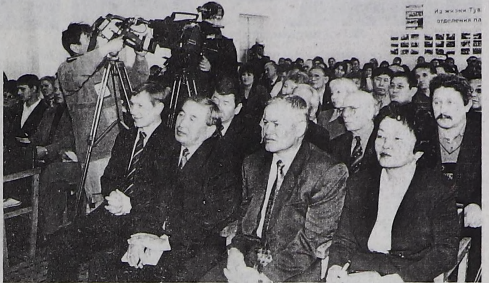
КУЭПО "Аныякка" ужуражышкын.

Россия Федерациязының Онза байдалдар болгаш хамааты камгалал яамызының сайыды, армия генералы, Россияның Маадыры деп бедик аттың эдилекчизи Сергей Күжүгетович Шойгу ноябрь 7-де — Чөпшээржилге болгаш эптежилге хүнүнде, төрөөн Тывазынга кээп, чурттакчы чон-биле болгаш «Чаңгыс аай Россия» партиязының Тывада девискээр салбырының удуртукчулары-биле ужурашкан.