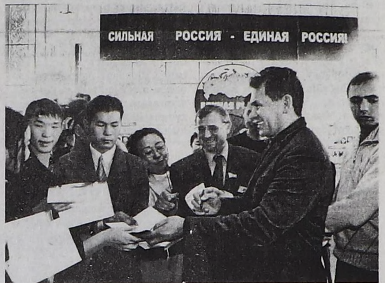
С.К. Шойгу студентилер-биле.

Студентилер-биле ужуражылга соонда С.К. Шойгу республиканың массалыг информация чепсектеринин журналистеринге парлалга конференциязын эрттирген. Аңаа журналистер политиктиг уjur-уткалыг айтырыгларны сайытка салып, чогуур уjurлуг харыыларны алган.