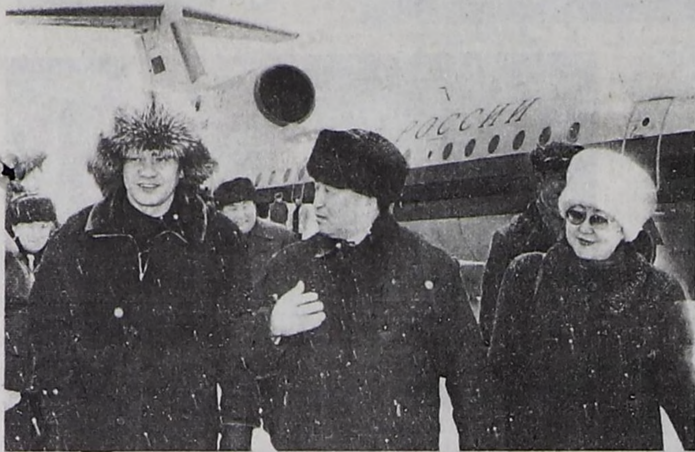
С.К. Шойгуну аэропортка уткуп турганы.