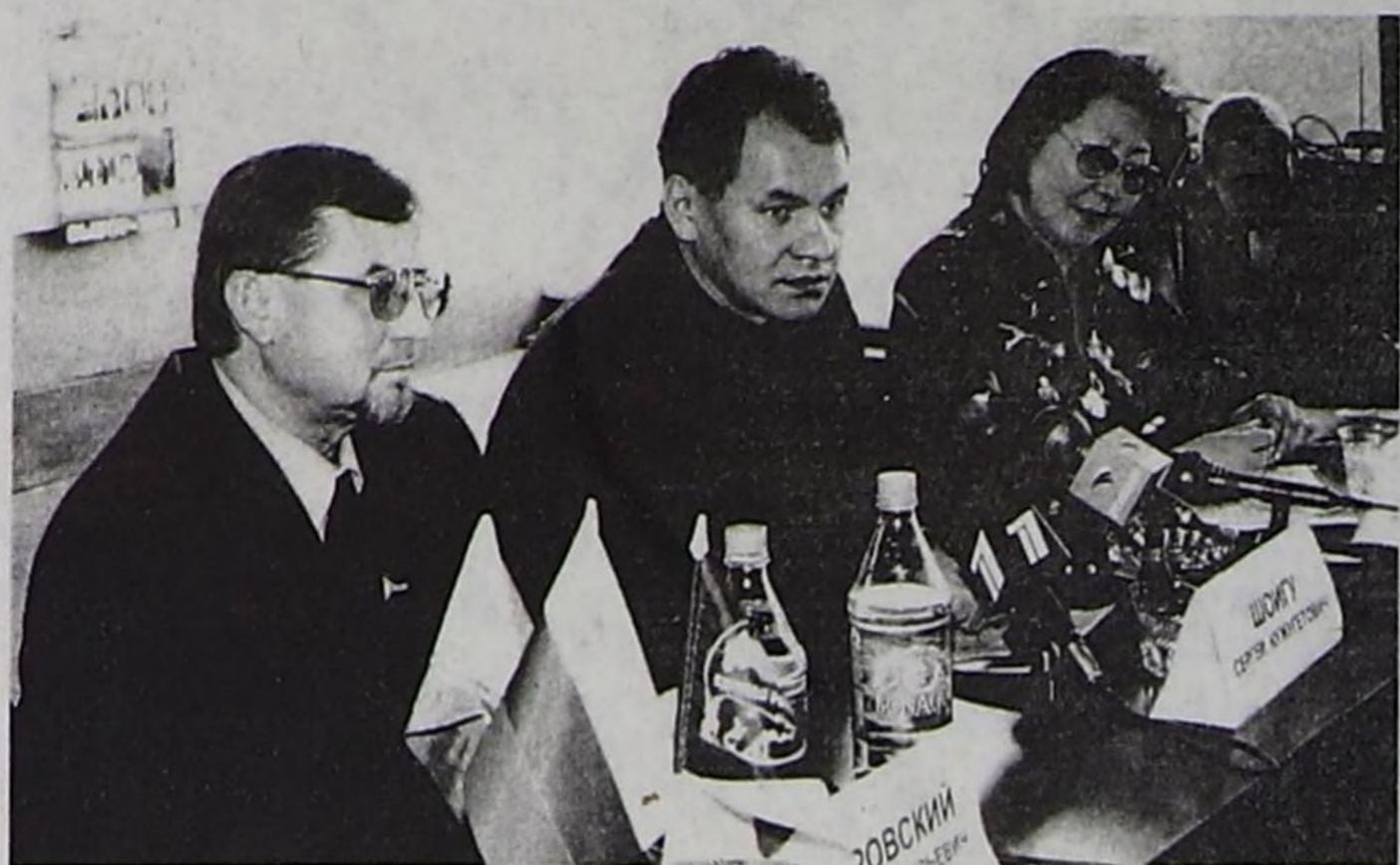
ТКУ-га ужуражылга үезинде.