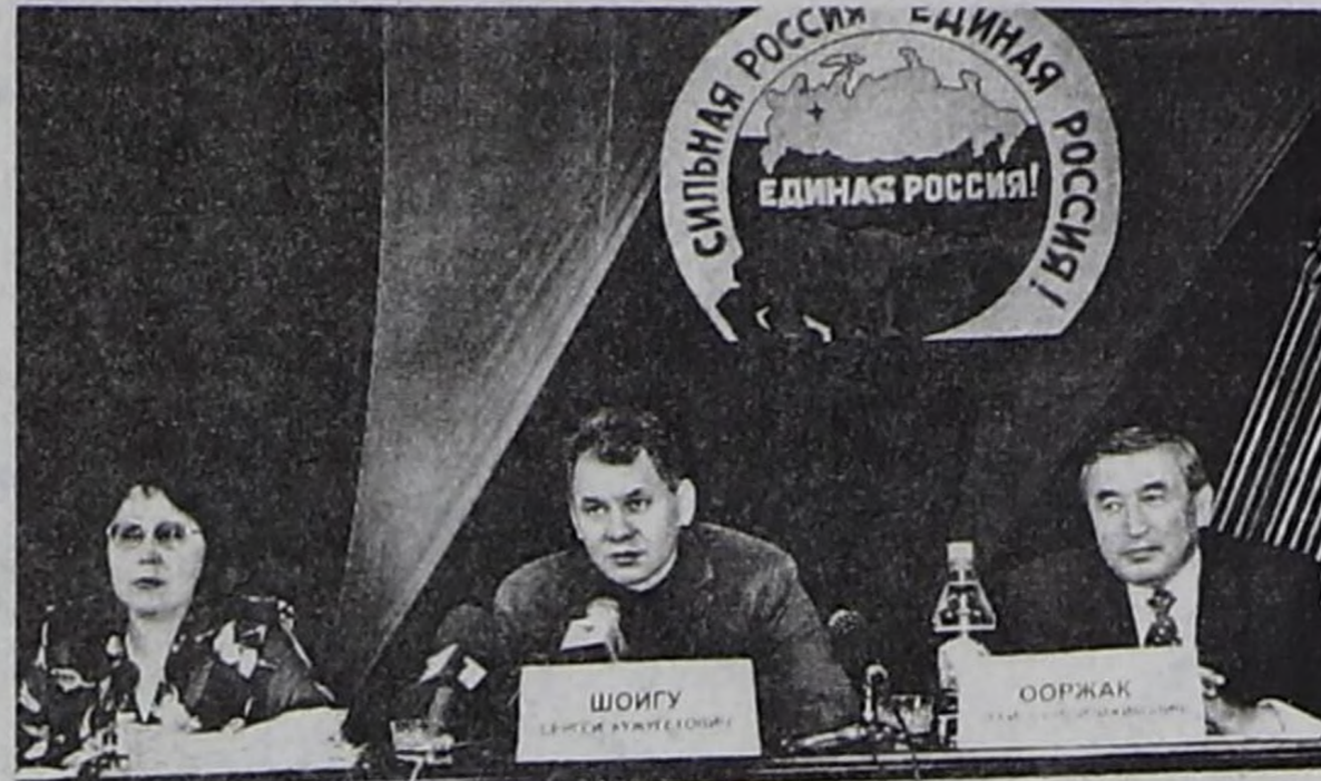
Хөгжүм-шии театрынга ужуражылгада.

С.К.Шойгу бодунун талазындан Шолбан Кара-оол езулуг эр