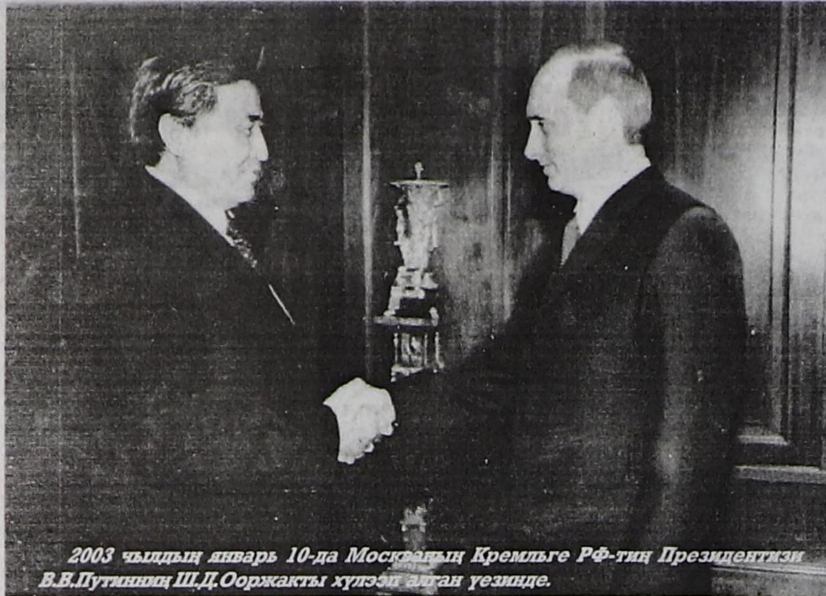
2003 чылдың январь 10-да Москвада Кремльге РФ-тин Президентизи В.В.Путиниң Ш.Д.Ооржакты хүлээп алган үезинде.

Ат салган шагы 19.50 Садар өртээ 3 рубль.