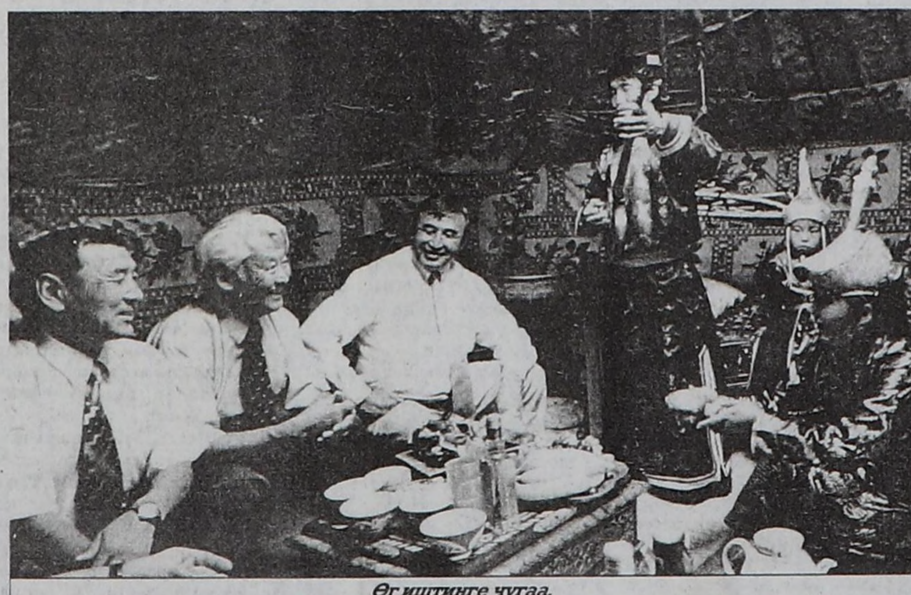
Өг иштиңге чугаа.

Соңгукчуларның 1133 чагыының 325-и, шүгүмчүлөлдиг 28 саналының 13-ү, хамаатыларның 30