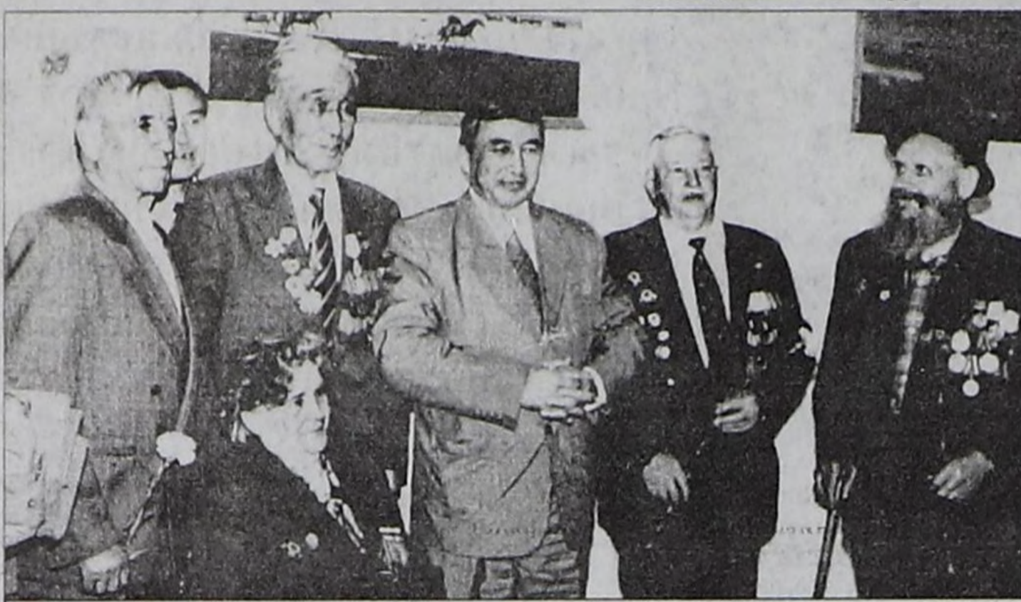
Ш.Д. Ооржак дайынның хоочуннары-биле кады.

— Чазак Даргазының соңгулдалары болгандан бээр бир чыл эрткен. Бо үениң дургузунда Силерниң соңгулда мурнунуң про-