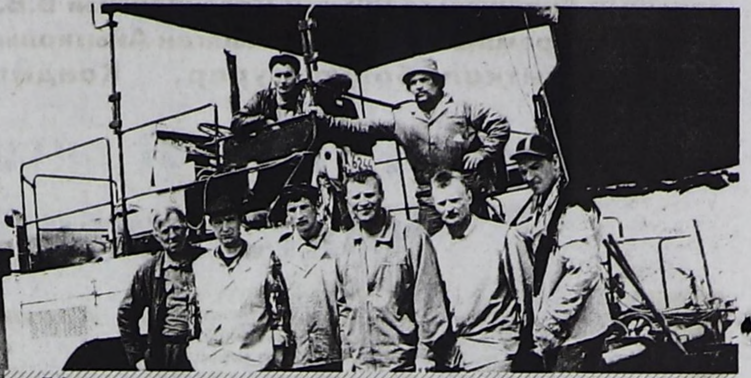
Абазаның орук-септелге-тудуг эргелелиниң бөлүк ажылчыннары.