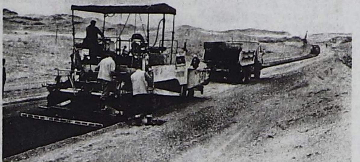
Автоорукта асфальтыны салып турары.

Мээн борта бир демдеглескээр чүүлүм 1977 чылда кылдырган завод, бо хүнге