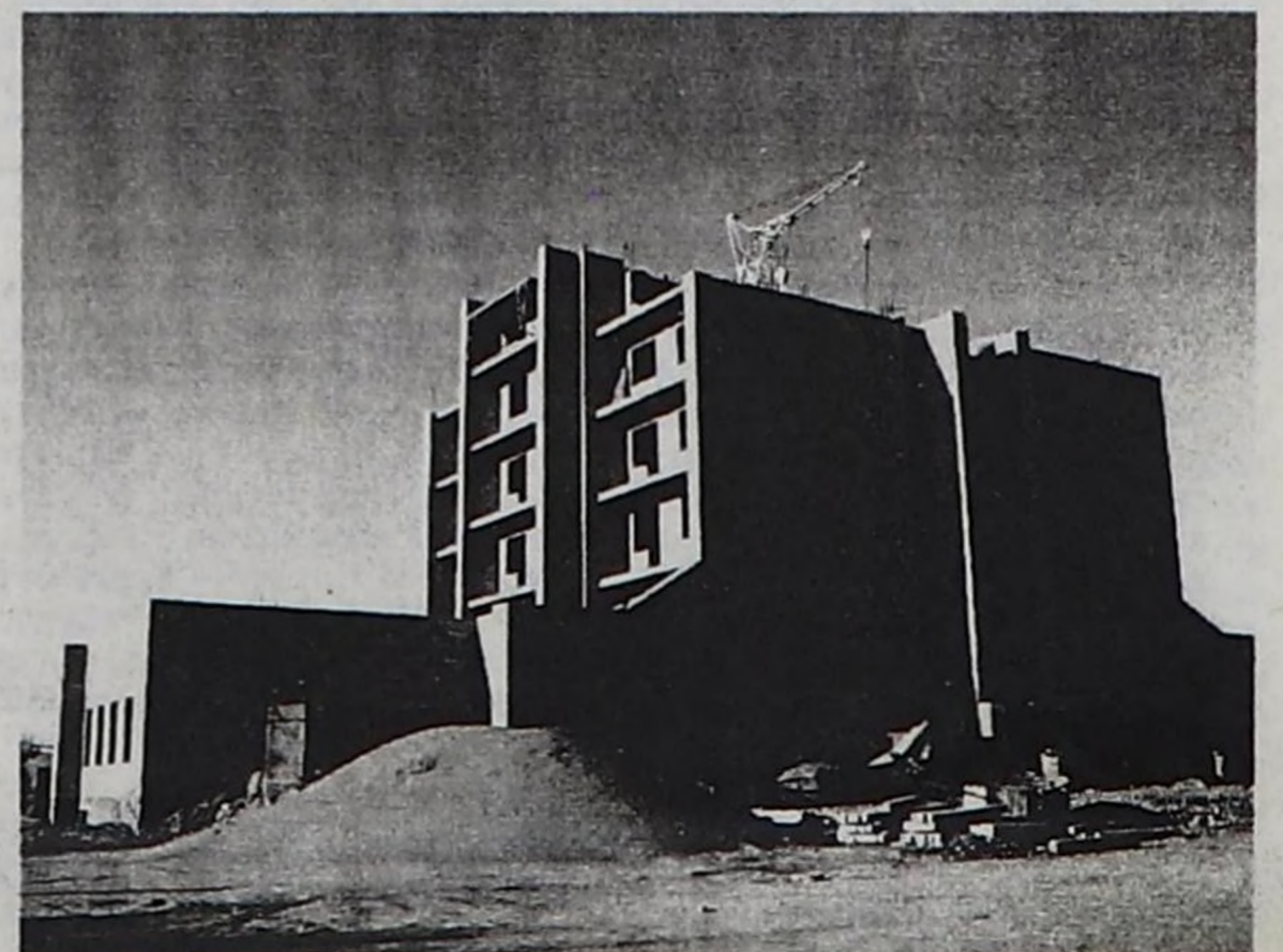
Малчыннарның аалчылар бажыңының тудуунун ниити хевирин.