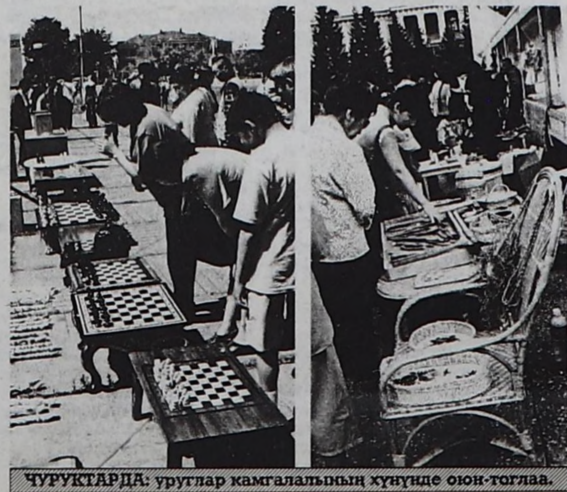
ЧУРУКТАРДА: уруглар камгалалының хүнүнде оюн-тоғлаа.