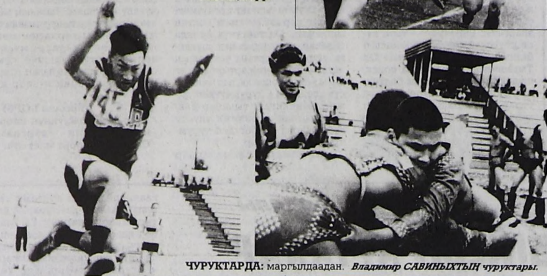
ЧУРУКТАРДА: маргылдаадан.