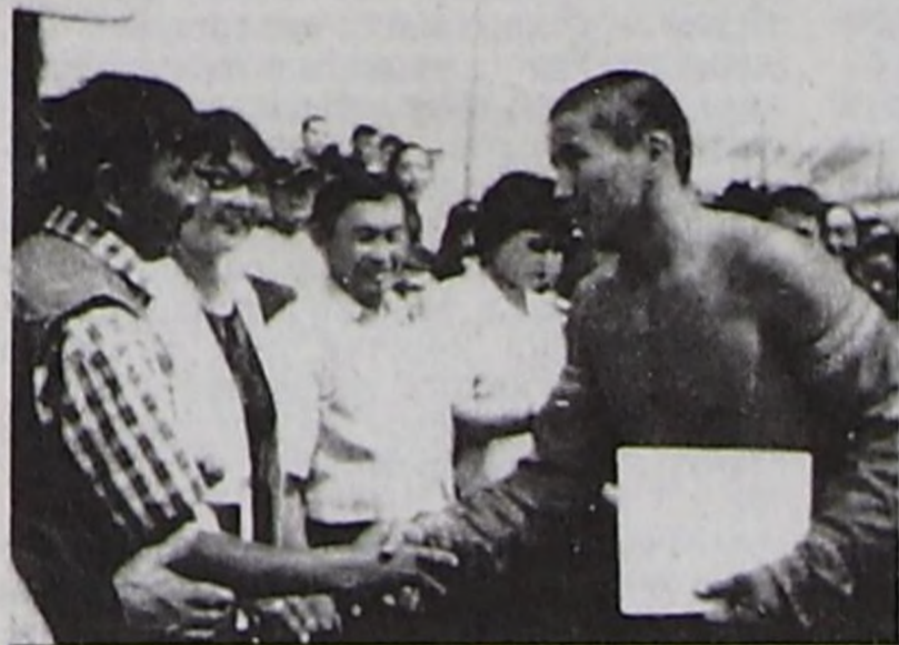
Аныяк мөге — Аңгыр Куулар.