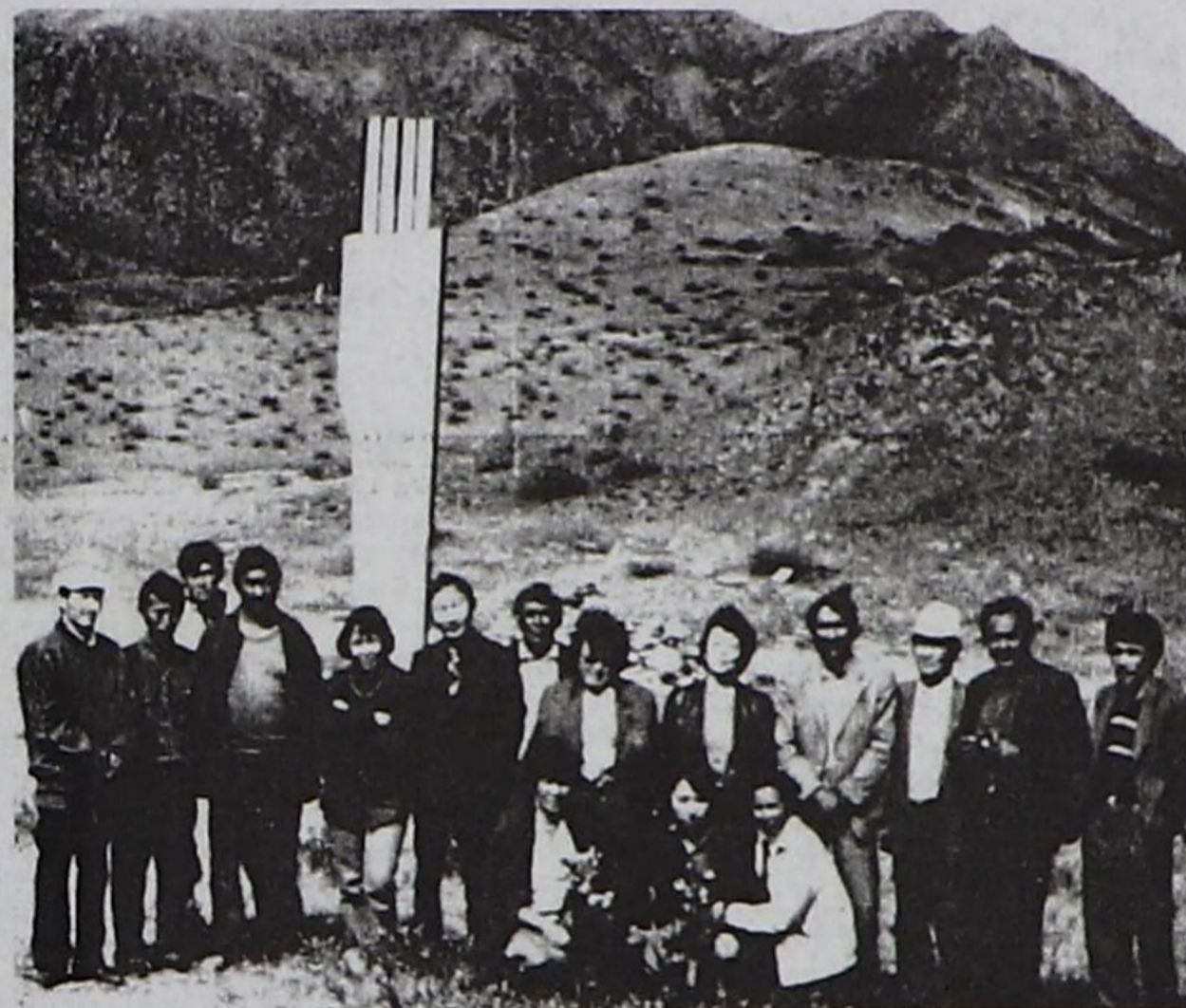
Кара-Дагның Сарыг-Сиген артының кырында алдан-маадырларга тураскаалды тургускан. Ооң чанында республиканың бөлүк журналистери.