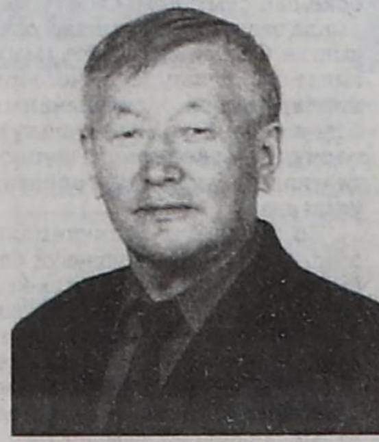
чылынга тураскааткан байырлал бөгүн Сүт-Хөлде эгелей берген.

Тыва улустун төөгүзүндө кезээ мөңгедө балаттынмас болуушкун — алдан-маадырларның тура халышкынының 120