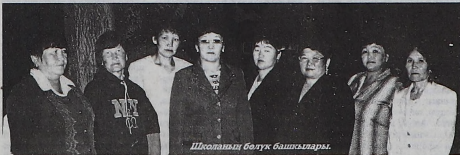
Школаның бөлүк башкылары.

Школавыс доозукчулары чылдың-на дээди болгаш ортумак өөредилге черлеринче дужаап кирип ап турарлар. Ол талазы-биле кожуун школаларының аразында ийиги черде турар бис. Бо хүннерде доозукчуларыбыс боттарының шилип алганы