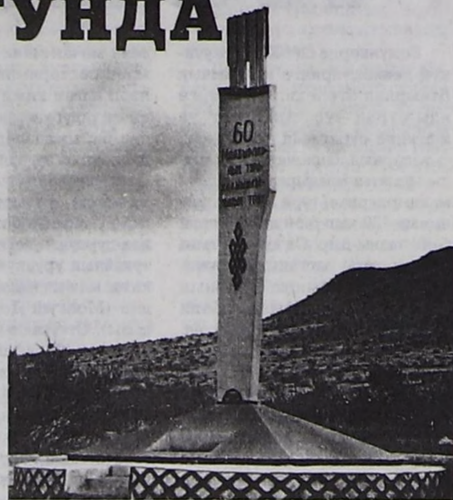
Сарыг-Сиген артында тураскаал.

— Суражаан өгбелеривистин аталдарын мөңгө жидерибиле тураскаалды төлевилеп чогаадыр, оон утказы кандыг болурунун дугайында бодал менээ шагда-ла кирген,