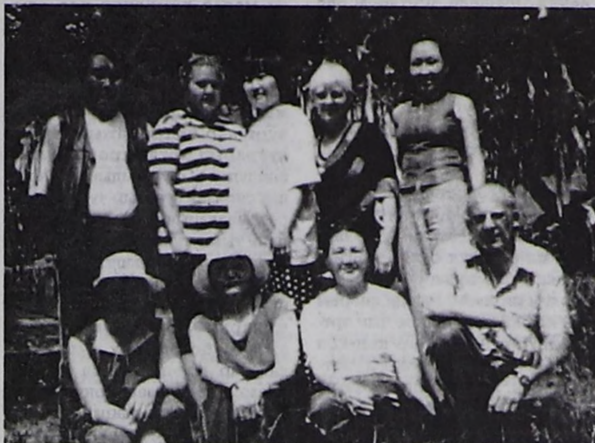
Учет-аналитиктиг төптүн комиссиязы база "Сайзыралдын" психолог башкылары.

Ам аржаан девискээринде турумчаан лагерлеринин аразында эң-не хөй дыштаныкчыларлыг "ЧЕЛЭЭШ" лагеринин пансионатына келдим. Барыин-Хемчик кожуунда назы четпестер талазы-биле социал дуза чедирер төптүн бо лагеринин 1, 2-ги сезону Барыин-Хемчик кожуунга хүндүскү хевирге эрткен. А бо хүннерде 3,4-кү стационарлыг сезоннарда ук кожууннун аңгы-аңгы суурларындан 137