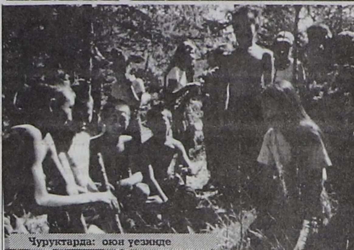
Чуруктарда: оюн үезинде