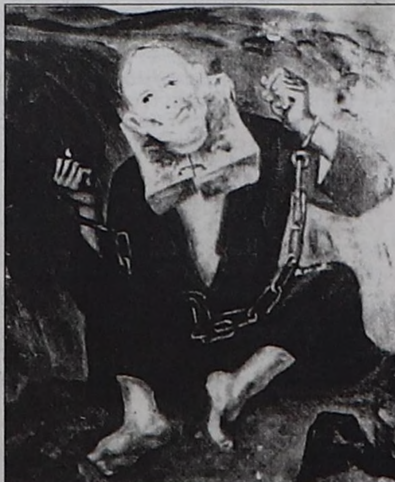
"Шаажылат мурнунда". В.Тас-оолдун чурраан чургуу.

Чоннуң ындыг тура халышкыннарында сестип, Цинь чазак хемчеглерни ап, тура халышкыннары баскаш, ооң киржикчилерин хемчег алган. Олар орус садыгжыларга хөй түннү төлээр болган. Кыдаттың Цинь чазак чамдык дүжүп беришкннерни кылып, Хемчик кожууннуң чагырыкчызы Хомушкуну дужаалы-