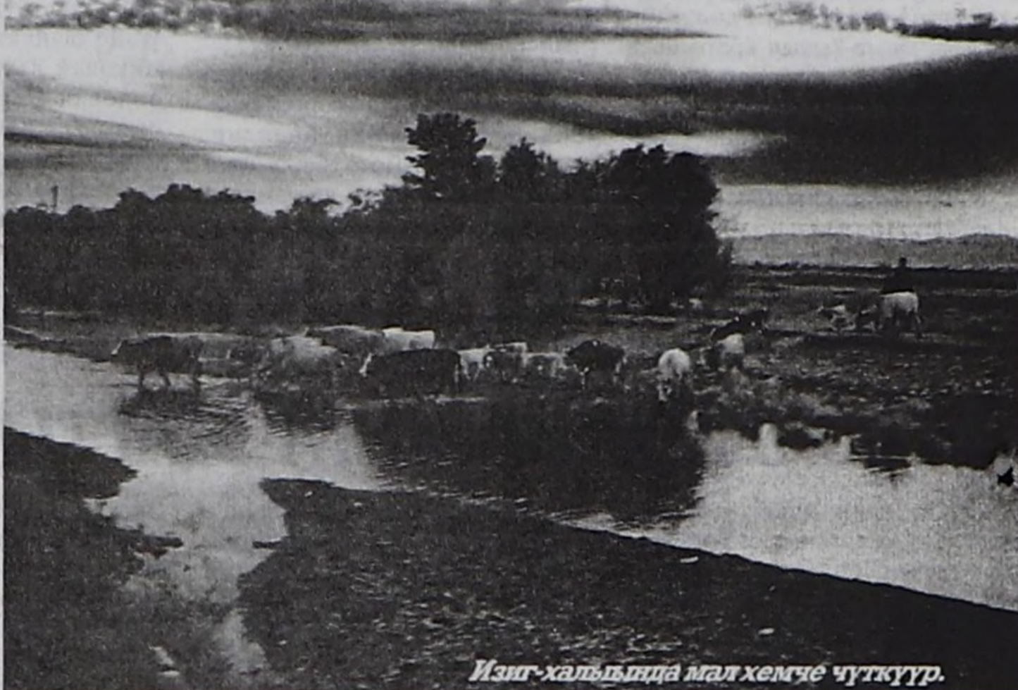
Изиг-халыында мал хемче чүткүүр.

— Сүт-Хөл чордум. Чай каңдаашкынында болза, көдээниң ажил-ишчилериниң хей-ады бедик-тир. Май 28-те өшкү кыргылдазы доозулган. 31614 баш өшкү кыргылтынган. Ооң иштинде көдээ ажил-агый коллективтериниң 2,7 тонна, өңчү-хөреңгини оон аңгыда хевирлериниң 25,9 тонна өшкү дүгү кыргылтынган. Хой кыргылдазын бо чылдың июнь