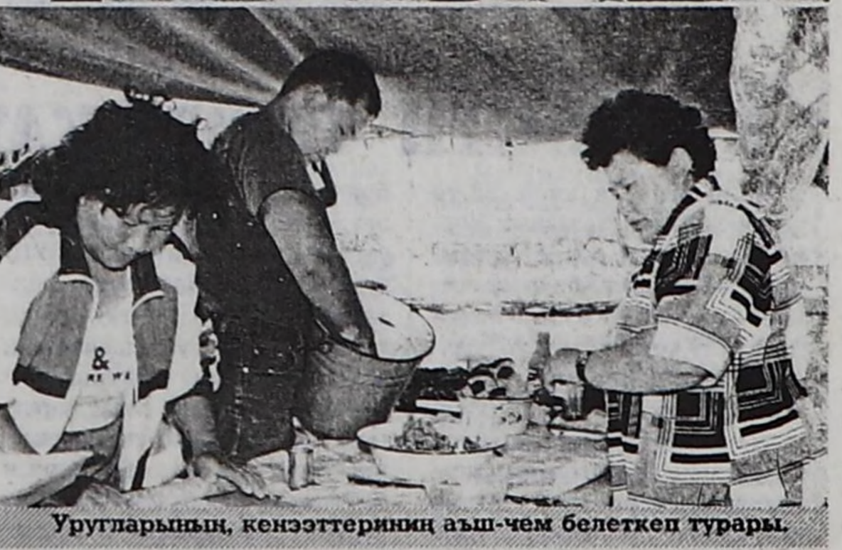
Уругларының, кенээттериниң аш-чөм белеткеп турары.

чүьктерни ынай-бээр сөөртүр ийи чүьк машиназы ажылдап турар. Тараа, картофельдин дүжүдү эки болганындан боттарының херегелелинден артыкшылдыг болу бээрге, хереглээн организацияларга, кижилерге садыглаар болу берген. Ынчангаш арат ажил-агыйы орулгалыг болу берген.