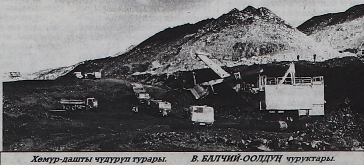
Хөмүр-дашты чүдүрүп турары. В. БАЛЧИЙ-ООЛДУҢ чуруктары.

— «Каа-Хем» хөмүр-даш уургайы орулгалыг ажылдап болур бүдүрүлгө-дир. Ону чүгле өрөлөр бергедеп турар. Бо чылдын август 1-ниң байдалы-биле алырга, бистин хереглекчилерде өрөвис мындыг: «Тыва-энерго» ХАН — 47,070 муң рубль, «Тывакоммунэнерго» ККБ — 13,851 муң рубль, республиканын одаар чүүл садып-сайгарар конторазы 10,369 муң рубль. Ниити өрөниң түнү 71,649 муң рубль чедип турар.