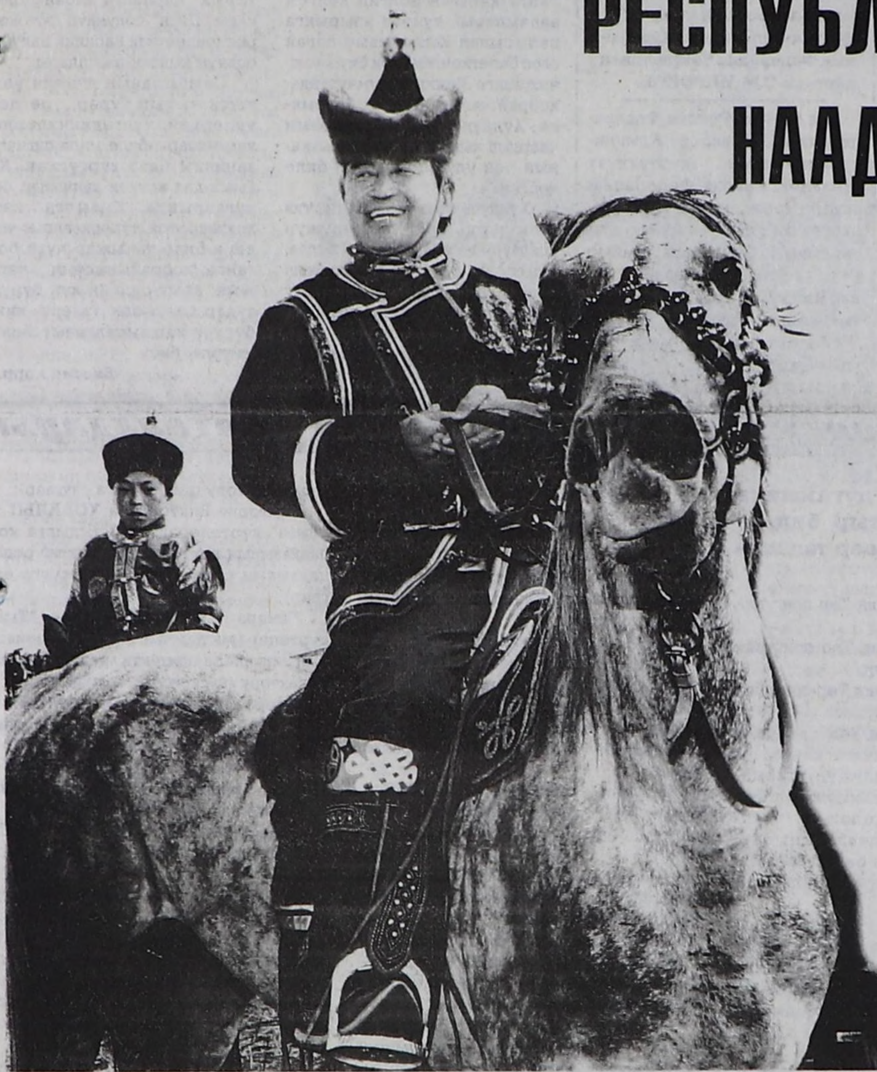
«Эки аът ээзин байыдар, эки эр чуртун байыдар».