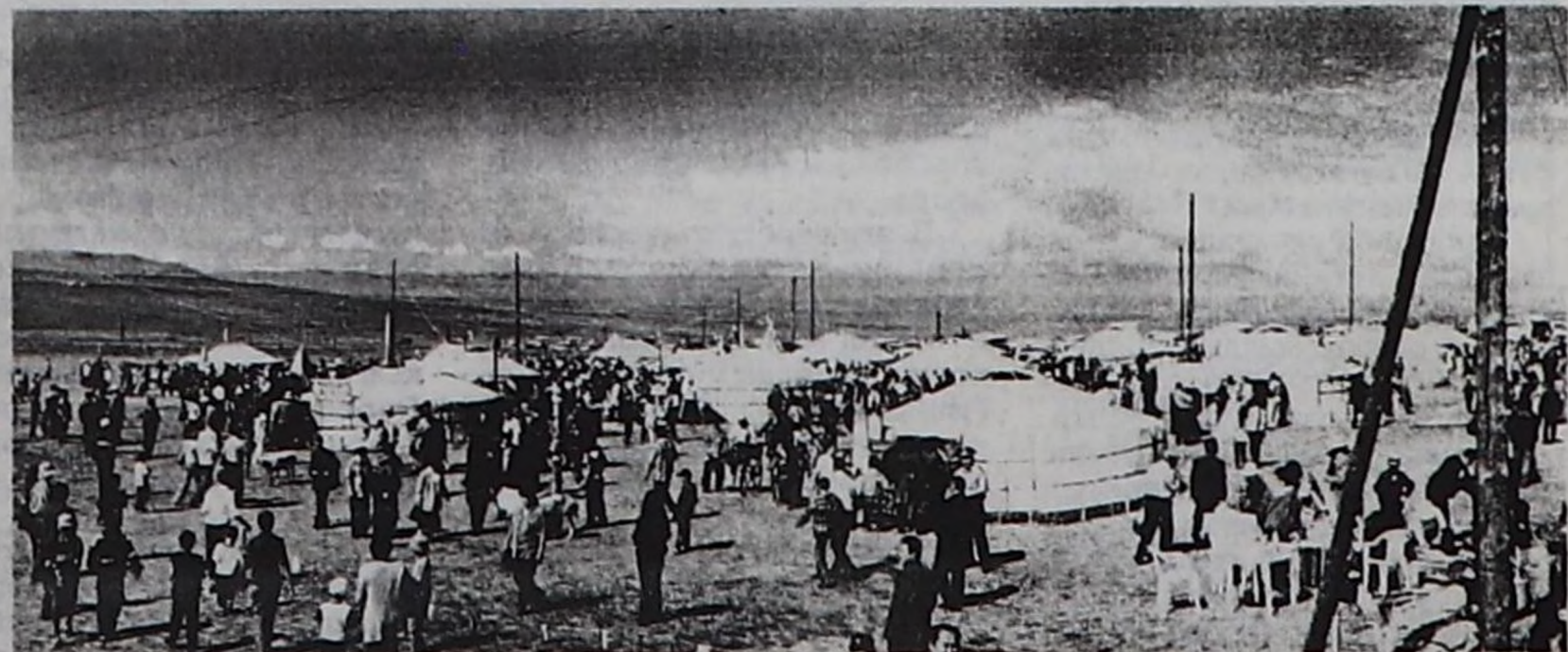
Өглер хоорайжыгажы каш хонук дургузунда келген чоннун кичээнигэйн бодунче хаара туткан. Өгнү кым магадапас, сонургапас боор.