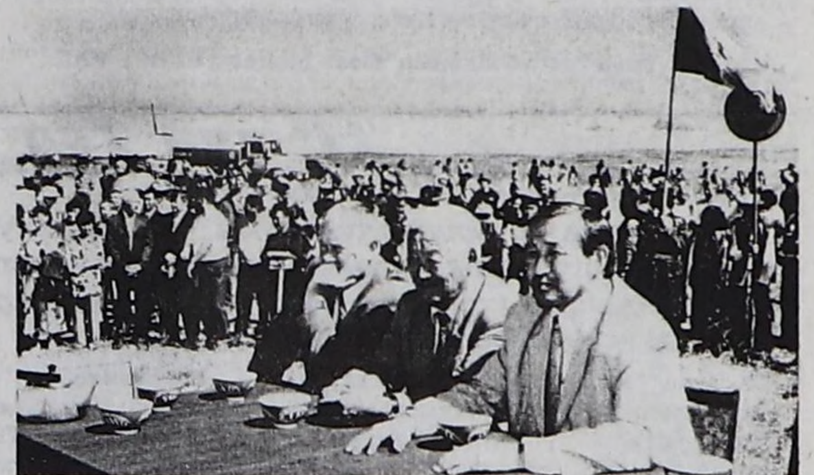
Тос-Булакка эрткен байырлалдан.