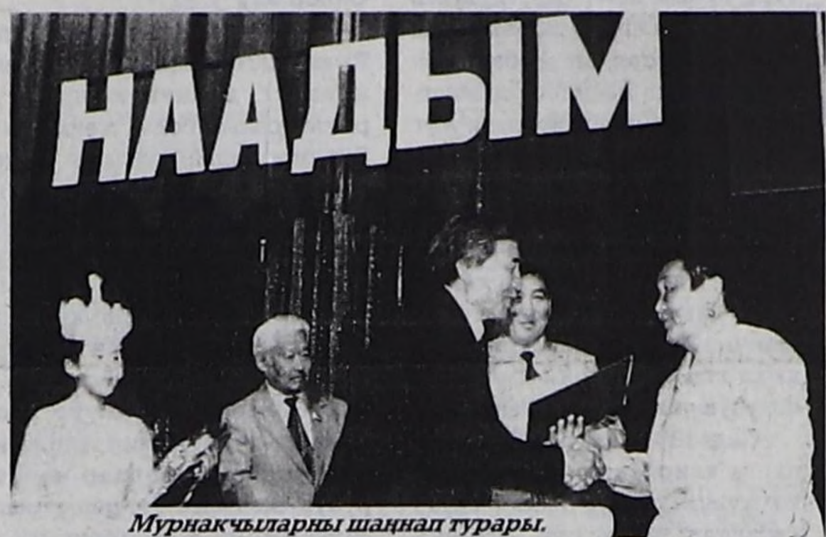
Мурнакчыларны шаңнап турары.

Наадым байырлалының хүнүнде республиканың экономикаының болгаш чоннуң амьдыралының үндөүсүнүн тур-