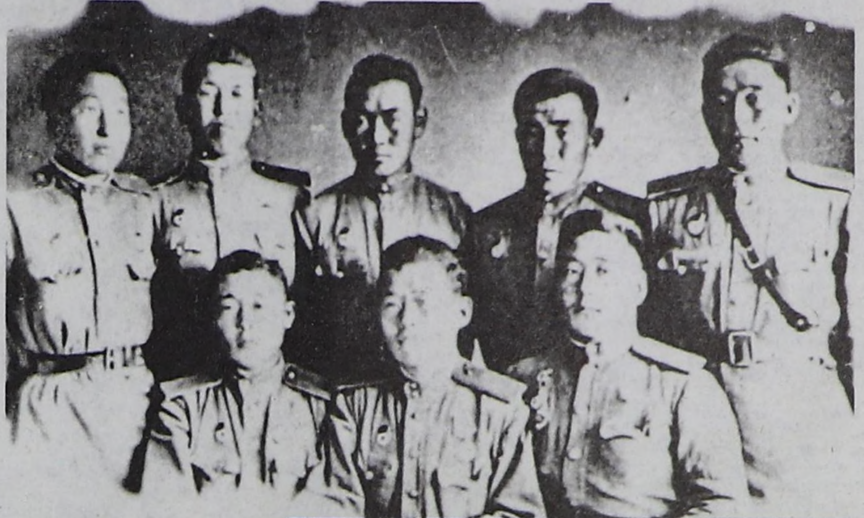
Бөлүк тыва эки турачылар.

Николай МАКАРЕНКО, Совет Эвилелинің Маадыры.