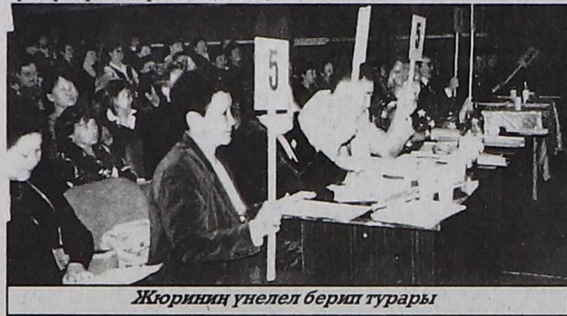
Жюрииниң үнелел берип турары

«Российская газета» солундан допчулап очулдурган.