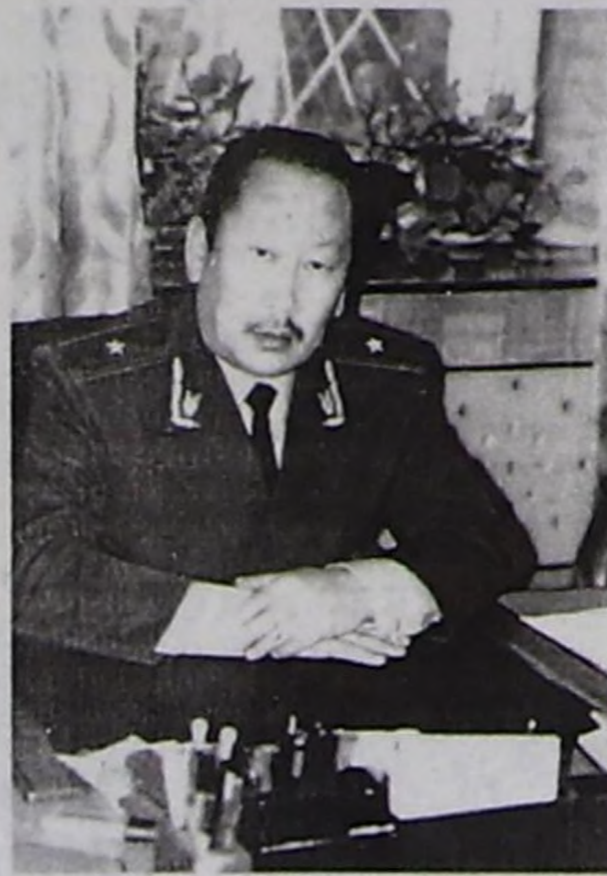
Михаил САНЧАЙ, Тыва Республиканың прокурорунуң бирги оралакчызы: