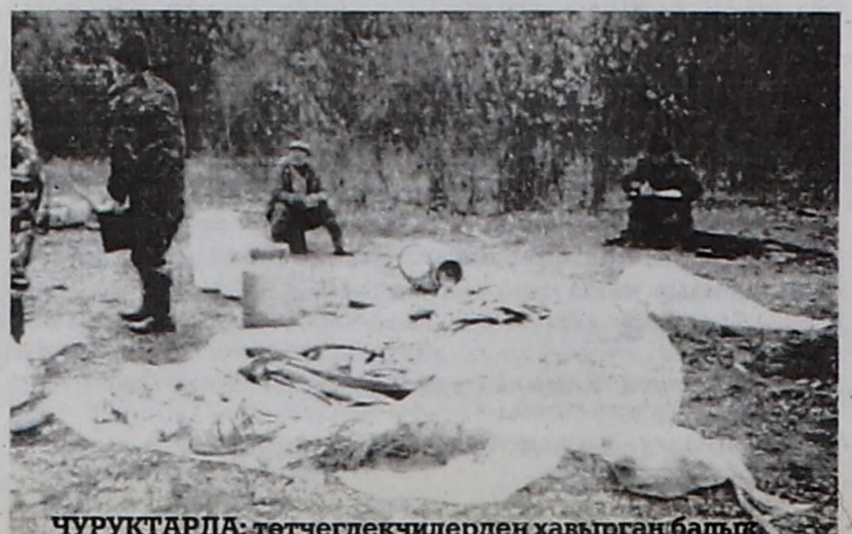
ЧУРУКТАРДА: төтчеглекчилерден хавырган балык