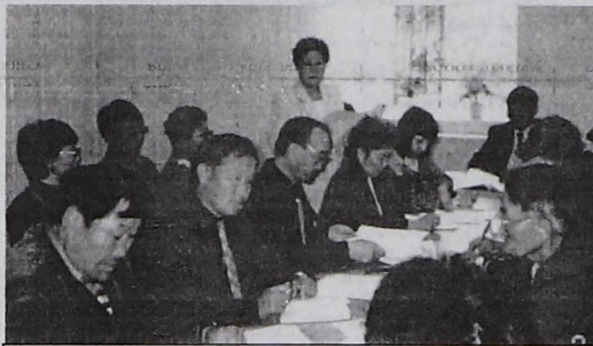
Чер-черлерде төптөр удуртукчулары-биле семинар.

Эрткен чылдын деннели-биле алырга, ажыл чок кижилер-нин саны 44,6 хууга өскөн. Бүрүткеткен ажыл чоктарның хоорайда деннели 2,6 хууга, ниити ажыл чок чорук 18,6 хууга өскөн. Аныктарны ажылга тургузарындан аңгыда, мергежил чедип алыры-биле өөредип база турар. Улгады берген кижилерни дакпыр мергежилге эде өөре-