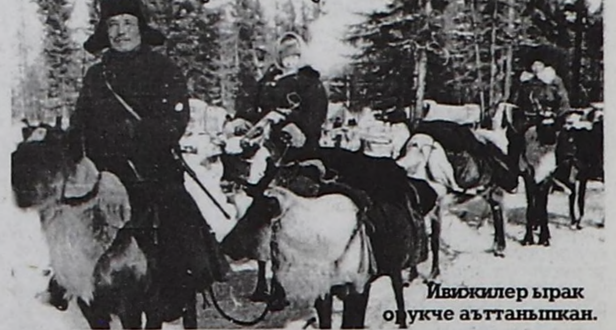
Ивижилер ырак орукче аътанышкан.