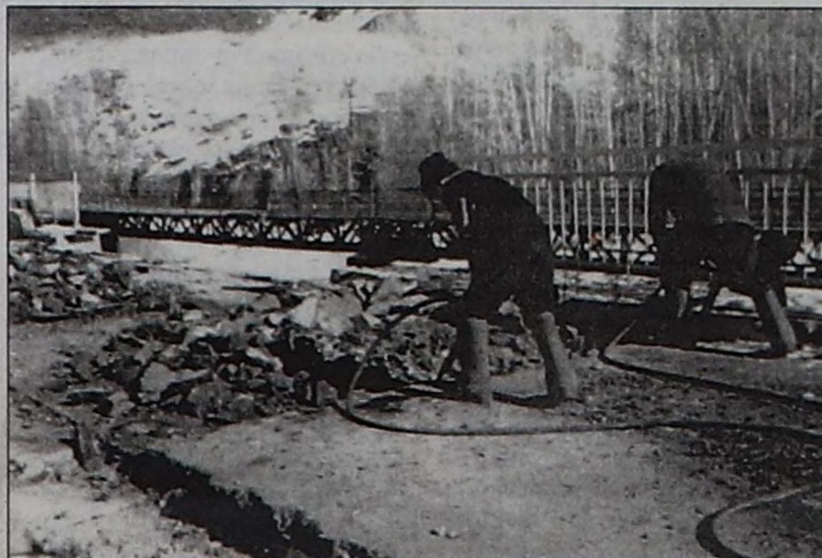
ЧУРУКТАРДА: Ак-Сугда көвүрүг септелгези; Ак-Довурак — Абакан аразында автоорукка түр үеде ажилтал турган көвүрүг.