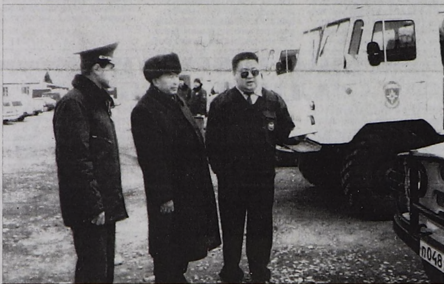
ЧУРУКТА: чаа техниканы Чазак Даргазының көрүп турары.

Октябрь 16-да ТР-ниң Чазак Даргазы Ш.Д. Ооржак соңгулда мурнундагы хемчеглерниң күүселдезинге дүүштүр республиканың Хамааты камгалал болгаш онза байдалдар яамызының ажилдакчылары-биле ужуражып, ында байдал-биле таньшкан.