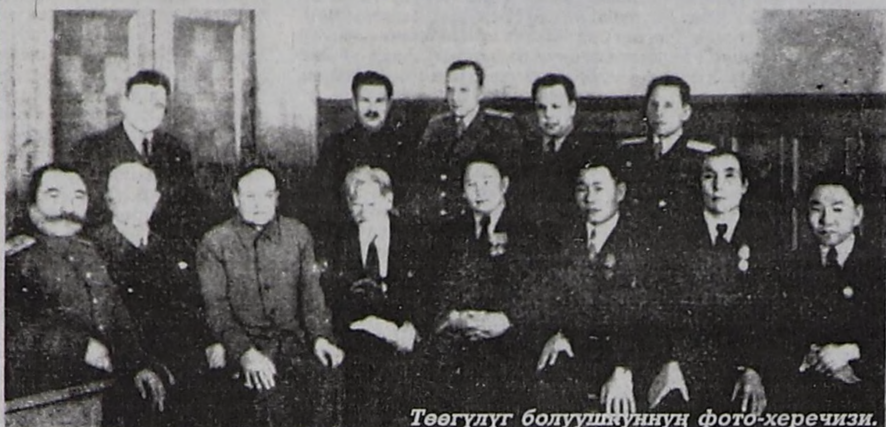
Төөгүлүг болушкуннун фото-херечизи.

1944 чылдың октябрь 11-де Тыва Арат Республика ССРЭ-нин составына РСФСР-нин автономнуг облазы кылдыр кирген. Оон бээр Тываның күрүне тургузуун, экономиказын, культуразын хөгжүдеринге делгем орук ажыттынган. Тывага үндезин чаартылгалар болган. Чаа суурлар, үлетпүр бүдүрүлгелери, колхоз-совхозтар, социал адырның албан черлери туттунган, өөрөдилге, культура, уран чүүл, спорт, эмнелге сайзыралды алган. Чурттакчы чоннун амыдыралының деңгели бедээн. Тыва автономнуг область Тыва АССР болу берген, эрге-байдалы улгаткан, тускай Конституциялыг күрүне болу берген.