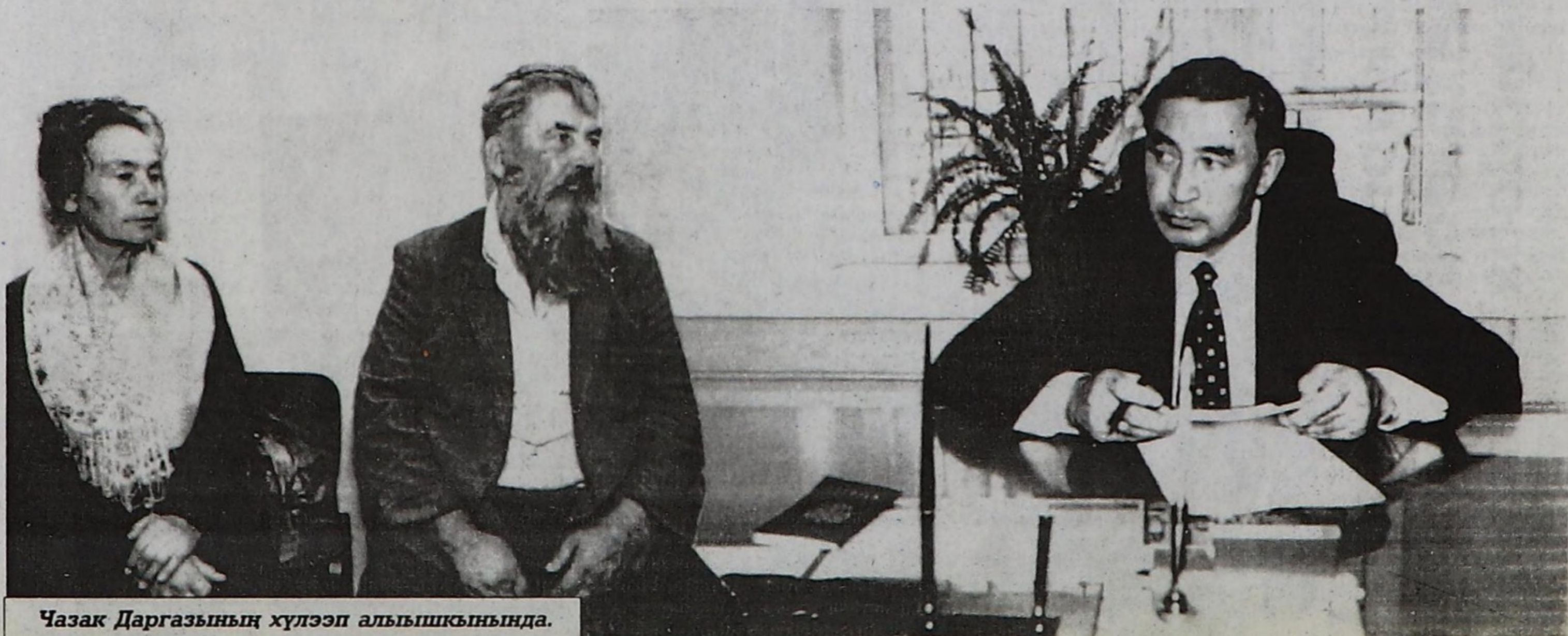
Чазак Даргазының хүлээп алышкынында.