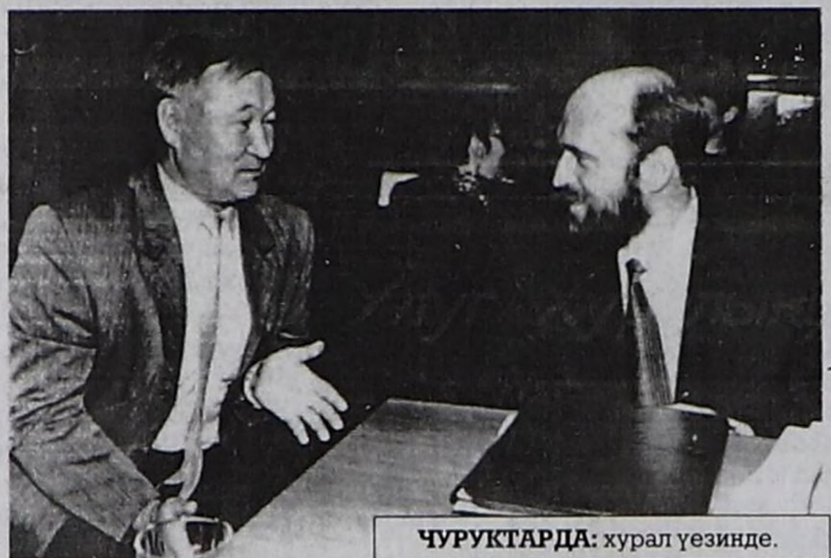
ЧУРУКТАРДА: хурал үезинде.