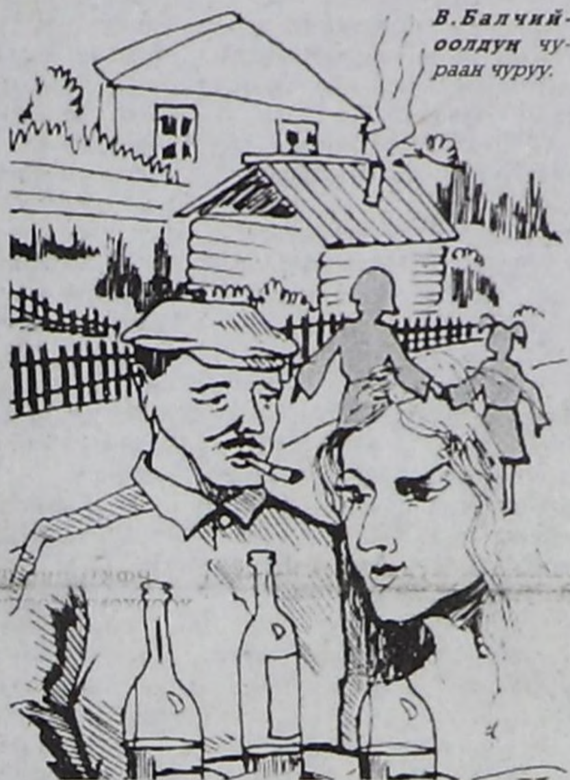
В. Балчий-оолдун чурраан чоруу.