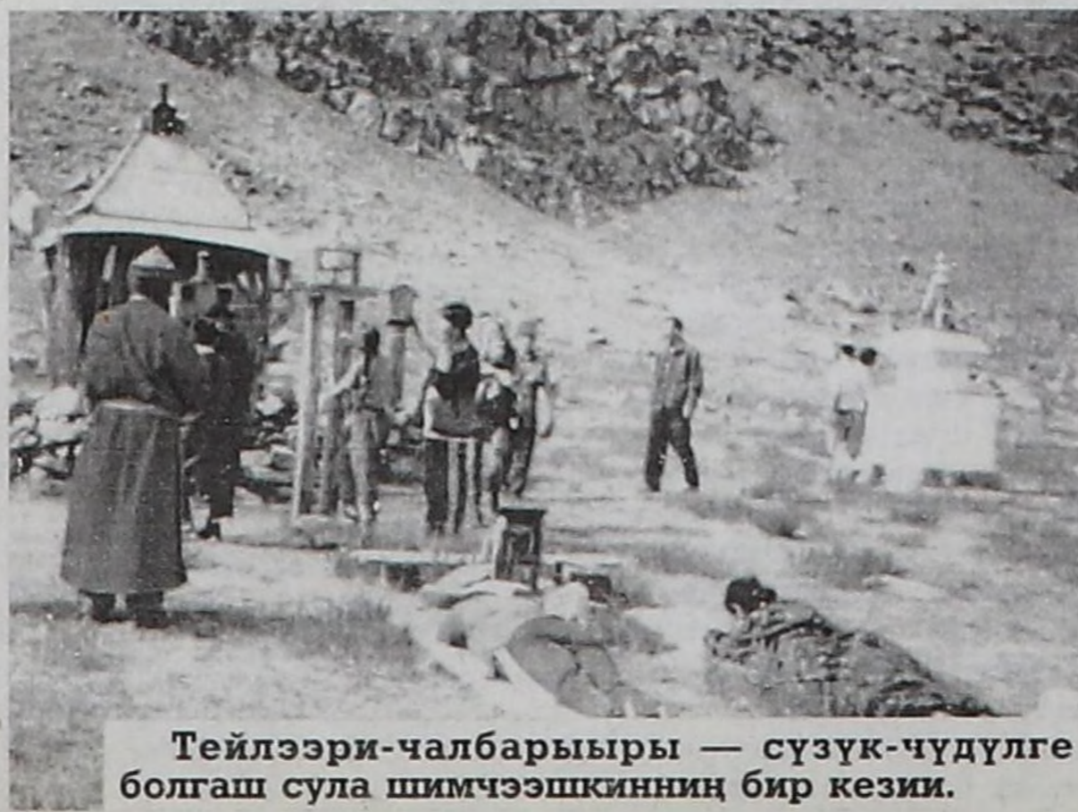
Тейлээри-чалбарыры — сүзүк-чүдүлге болгаш сула шимчээшкенин бир кези.

Саныга база ынча деп адаар кижжи болду. Тыва, моол, орус дылдарга ол хостуг чугаалаар. Эрзин диалект, аян-шинчи, ук чурту ол-даа болза, оң дылында билдинмес чорду. Улуг-Хем, Чөөн-Хемчик, Бай-Тайга чурттуг интеллигенция-биле бир мөзүлеш. Чүге дээрге рынок, экономика айтырыгларының тайылбыры тыва дыл дамчыштыр чер, мал ээлеринге чедип турар. Ук айтырыглар көдээде бөгүндө чидиг-чидиг. Республиканың кайы-даа булуңнарынга чедип, ол дугайын тайылбырлап чоруур. Дыл — билчишкенин кол чөпсээ. Ынчангаш тыва дылын езулуг литературлуг нормазын яамының экономика килдизиниң начальниги ажылгап чоруур.