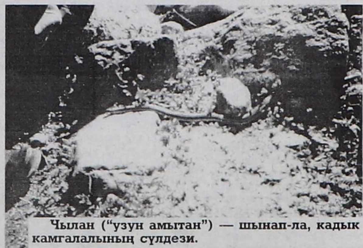
Чылан («узун амытан») — шынап-ла, кадык камгалалының сүлдизи.

Моолдар чыланни «узун амытан» дижир турган боор, Вилора