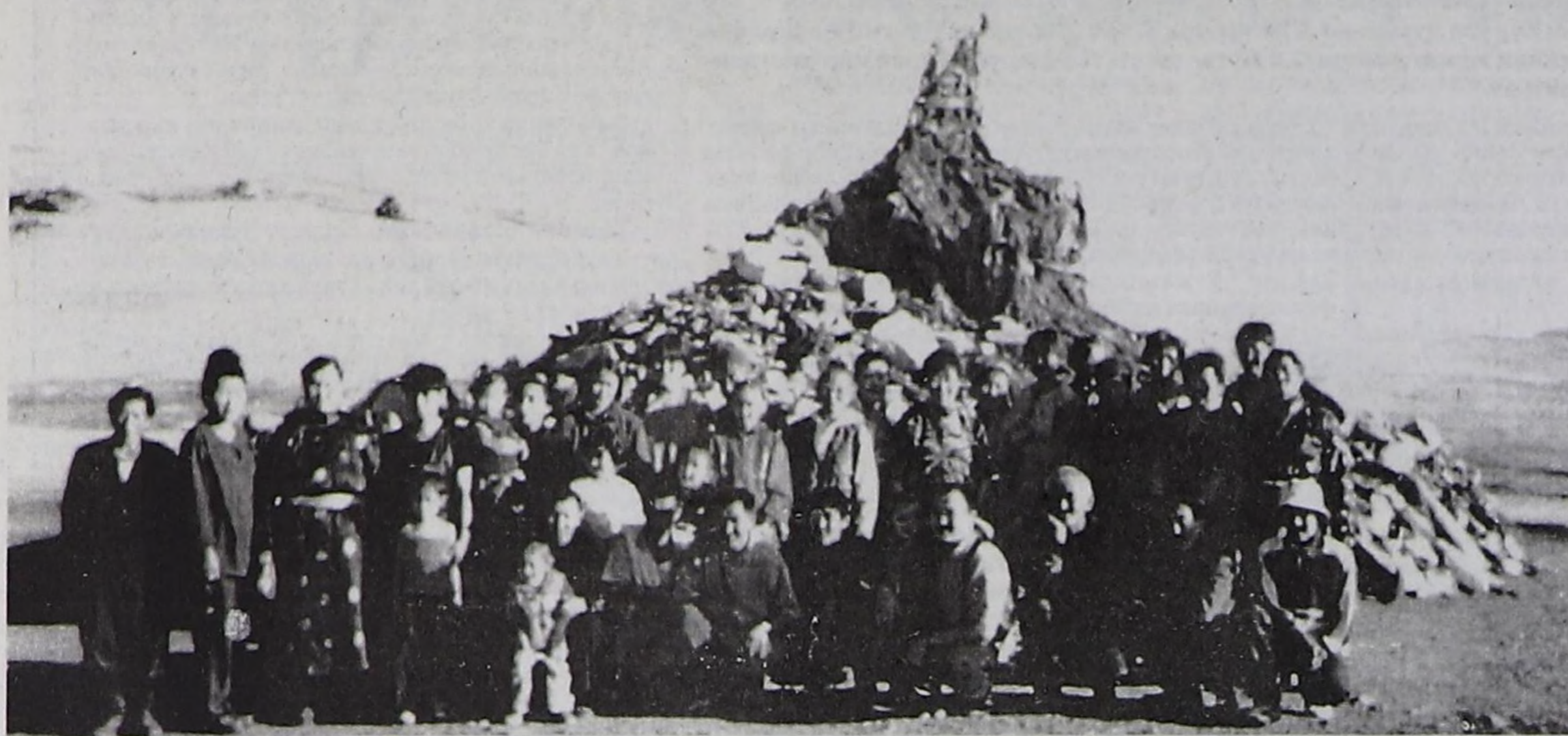
Оваа көк-көк кадактар-биле шиметтинген. Өске пөс, кескинди барык көзүлбес.