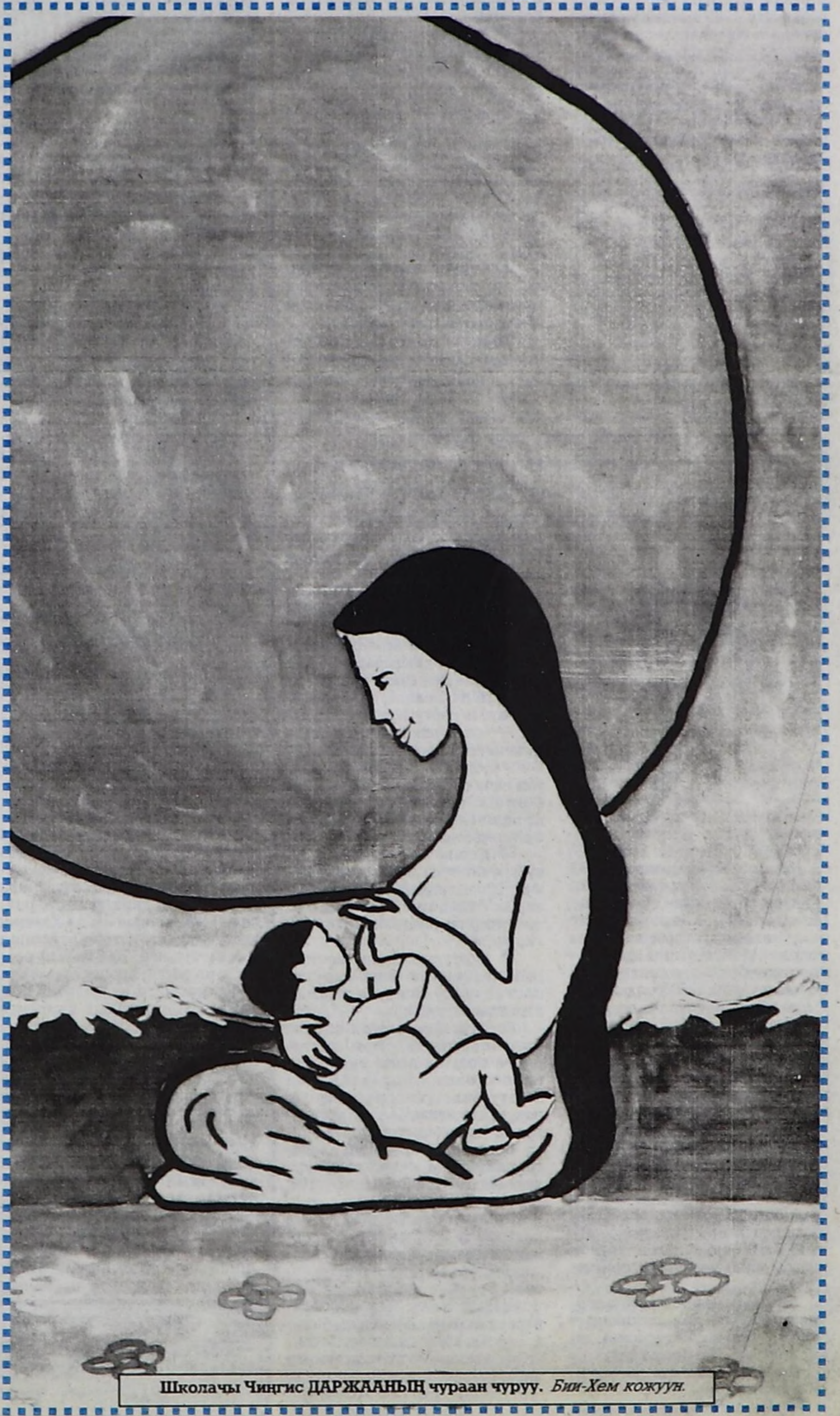
Школачы Чингис ДАРЖААНЫҢ чураан чуруу. Би-Хем кожуун.