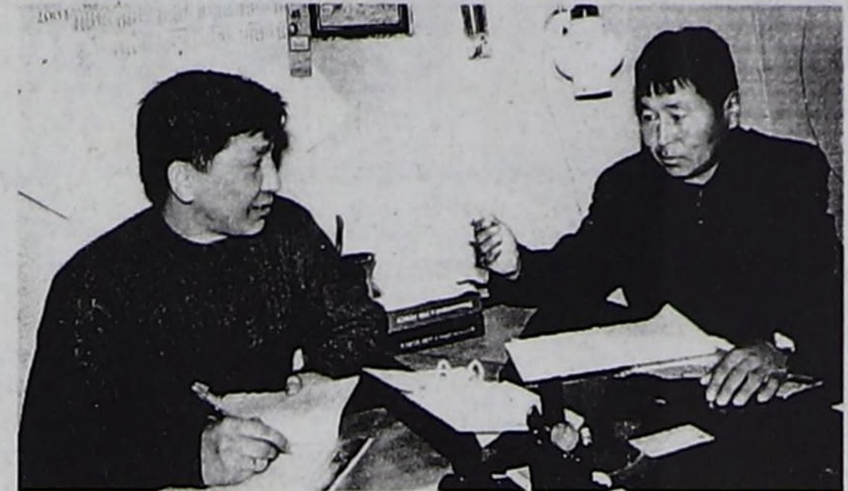
(Төңүзү. Эгези 1-ги арында).

Чамдыкта каразыттырып турар кижилерни суд органны ынай-бээр барбас кылдыр хол үжүү-биле салыптарга, олар улаштыр база оорлап туруп бээр таварылгалар эвээш эвес. Мал оорлааны дээш ниитизи-биле республика иштинден 205 кижиге кеземче херээн оттурган. Оларның аразындан 103 кижинин назы-хары улуг улуска хамааржыр, 15 назы-хары чепес элээдилер, 64 кижиче оон мурнунда кеземче херээнге онааттырып чораан бооп турар. Олар дегерези ажыл чок кижилер-дир. Ниитизи-биле мал ээлеринге чедирген когаралдың саны 910 муң 872 рубль бооп турар. Эрткен чылын бо сан-түң 1 млн. 768 рубльге ден турган.