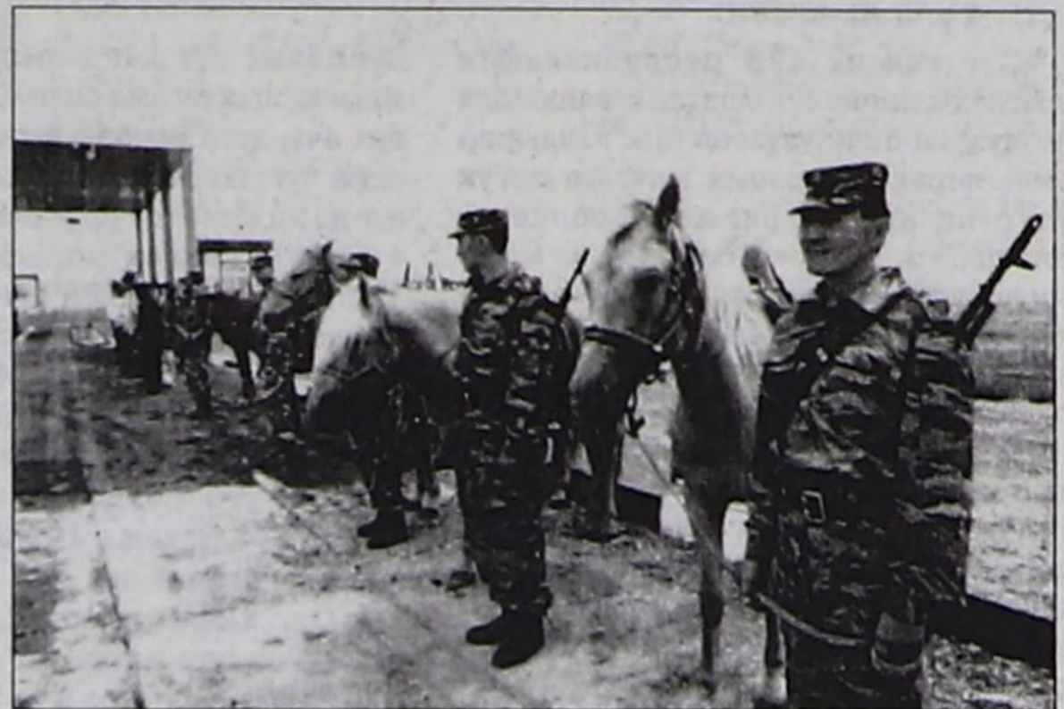
ЧУРУКТА: каайлы ажилдакчылары ажил үезинде.

Ол үеде каайлының 50 ажилдакчылары республика иштинге чүк бүрүткелин чорудуп турган. Даштыкы экономиктиг ажил-чорудулга кылып турган 54 хамааты демдеглеттинген. Республиканың даштыкы экономиктиг саарылгандан кирген