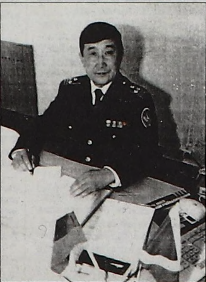
(Уланчызы 3-кү арында).

Тыва Республиканың девискээринге даштыкы экономиктиг ажыл-чорудулганы, барааннарны болгаш автотранспортту каайлы хыналдазынга алыры-биле РФ-тин Каайлы комитетиниң дужаалы-биле 1992 чылдың февраль 11-де Кызылга Красноярск каайлызының постузун тургускан.