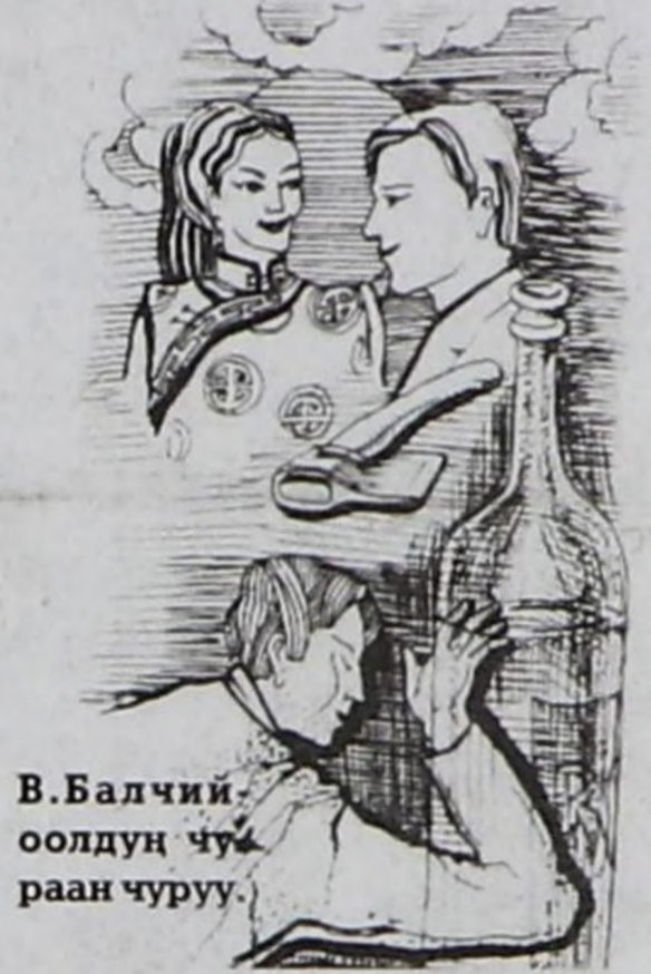
В. Балчи оолдун чураран чурар.