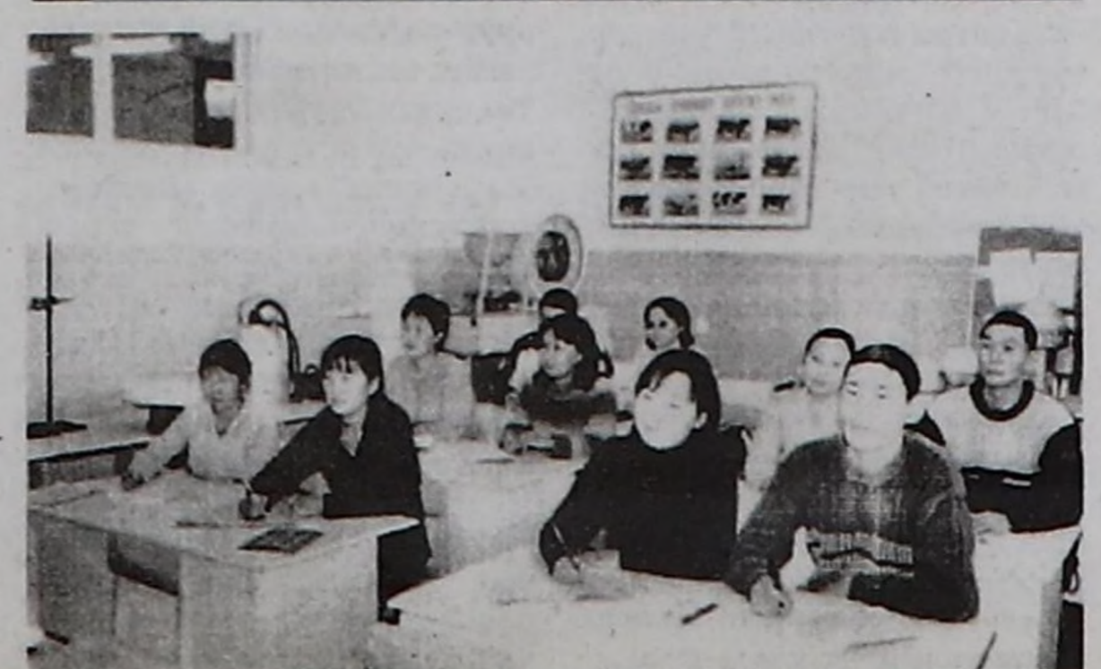
2-ги курстун агрономия салбырының студентилери.