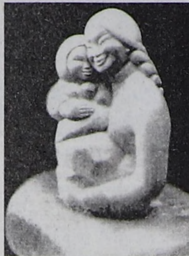
чонар шеверлерниң хей нуруузу дириг амытаннар дүрзү-хевирилерин чазаарынга сонугалдыг-