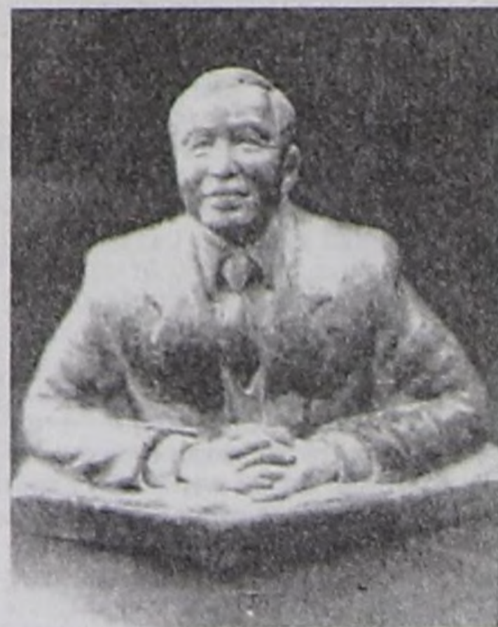
делегейге, Россияга алдаржыткан даш чонукчулары эвээш эвес. Оларның аразында кайгамчыктыг