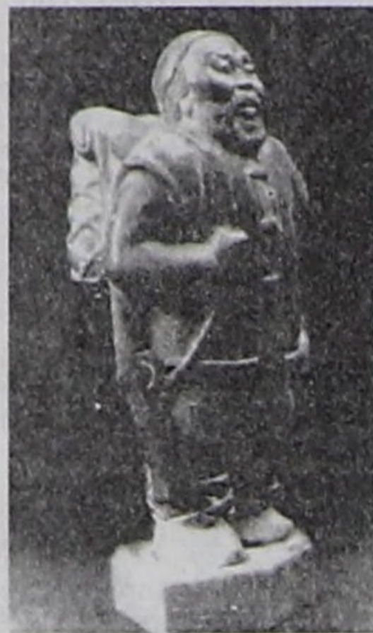
Байынды аңаа хамааржыр. Сураглыг даш чонар шеверлерниң өөредип кижизиткени