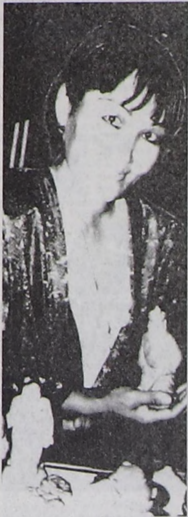
Тываның хей национал херээженнеринин аразында кандыг-даа мергежилдиг, кайгамчыктыг талантылыг кижилер хей. Ынчангаш олар республиканың

экономиказын, социал адырын, уран чүүлүн хөгжүдеринге улуг үлүүн кирип чоруурлар.