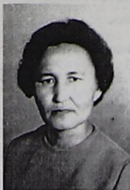
Хүндүткел-биле уруглары, төрелдери, өөреникчилери.

Силерниң кызыгаар чок чагай сеткиликер өзүп олар салгалды кижидип келгениңер, шыдамык чоруунар, деткимченер болгаш билишкениңер дээш улуу-биле четтирдивис. Эргим киживиске бьжыг кадыкшылды, чагай кежик-чолду, амырдышты, бистиң аравыска ам-даа сүмелекчивис, чоргааралывыс бооп чурттап чорууруңарны сеткиливис ханызындан күзедивис.