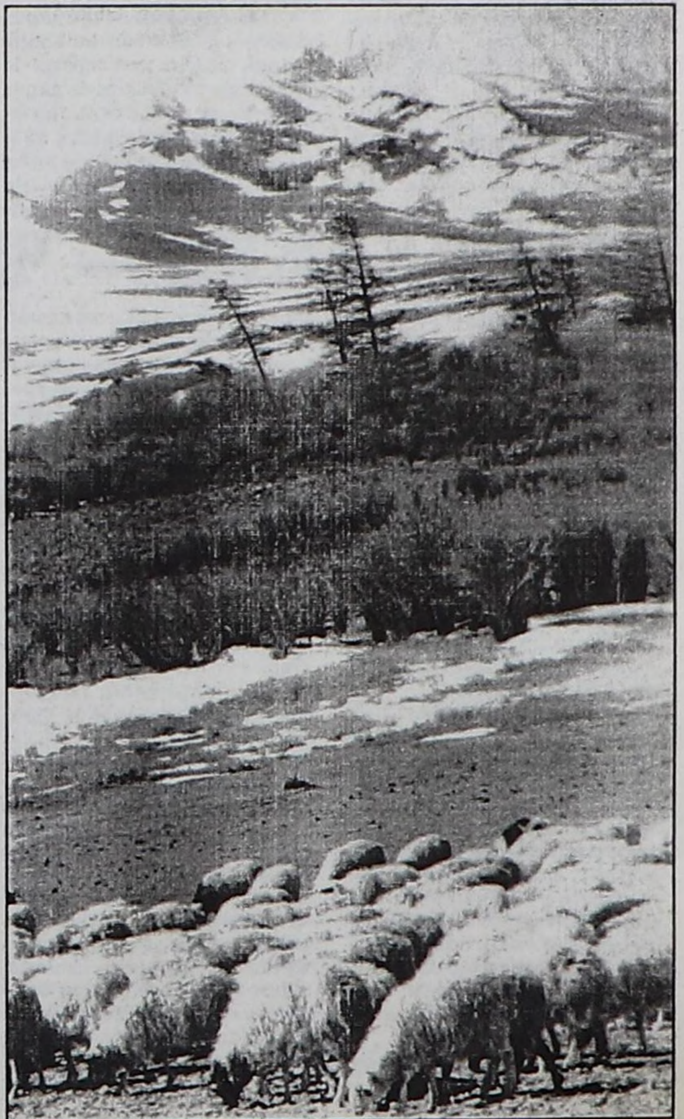
Одарда кодан хой.

ЧУРУКТА: Казылган-Аксының үерге алыскан көвүрүү.