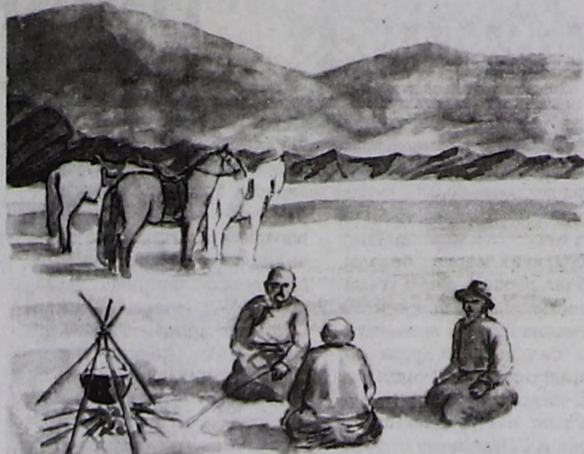
"Эрги өднүктөр". Геннадий МАКАРОВТУҢ чураан чуруу.