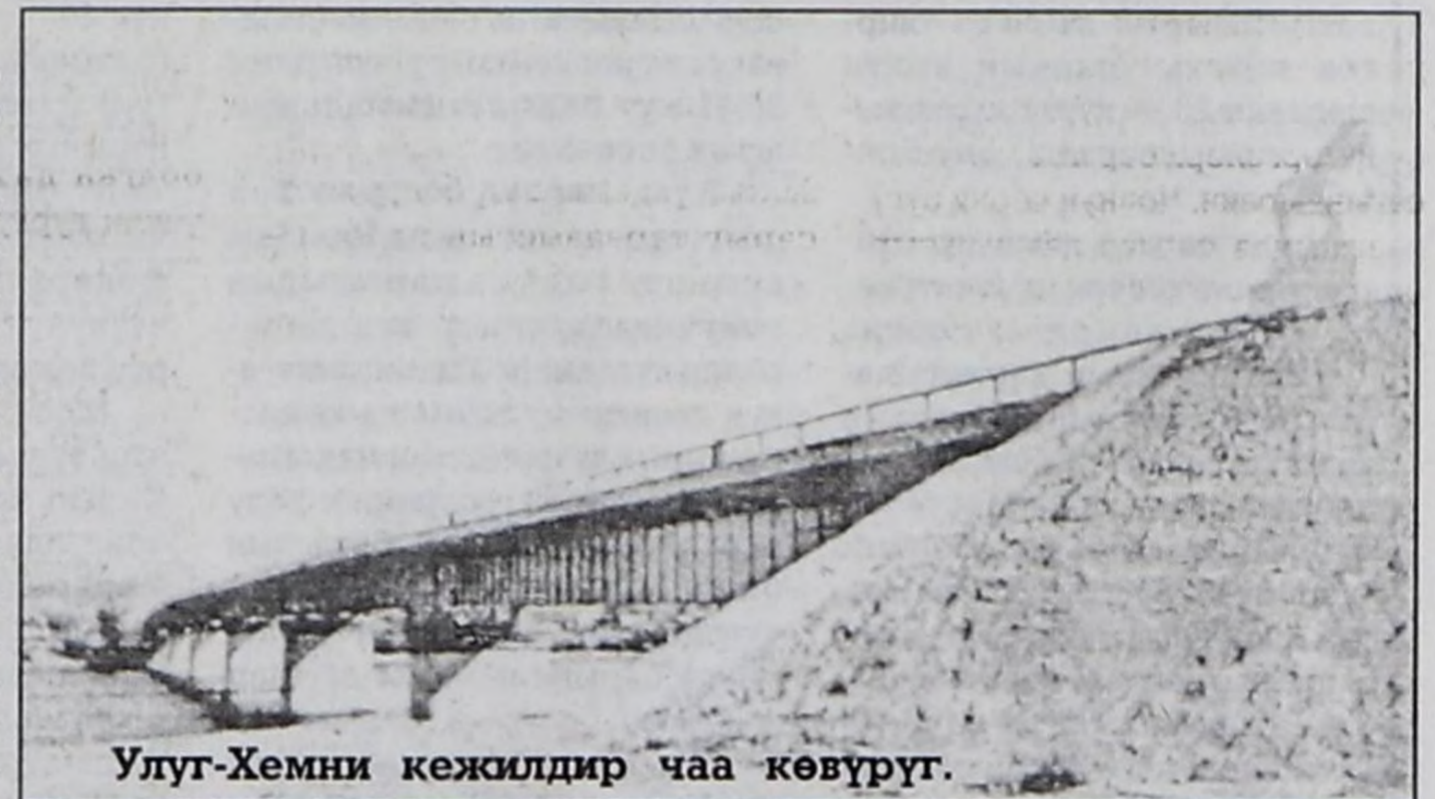
Улуг-Хемни кежилдир чаа көвүрүг.

Чуртталга бажындарының тудуунче бистиң яамының кичээнгеи улуг. 2003 чылдын