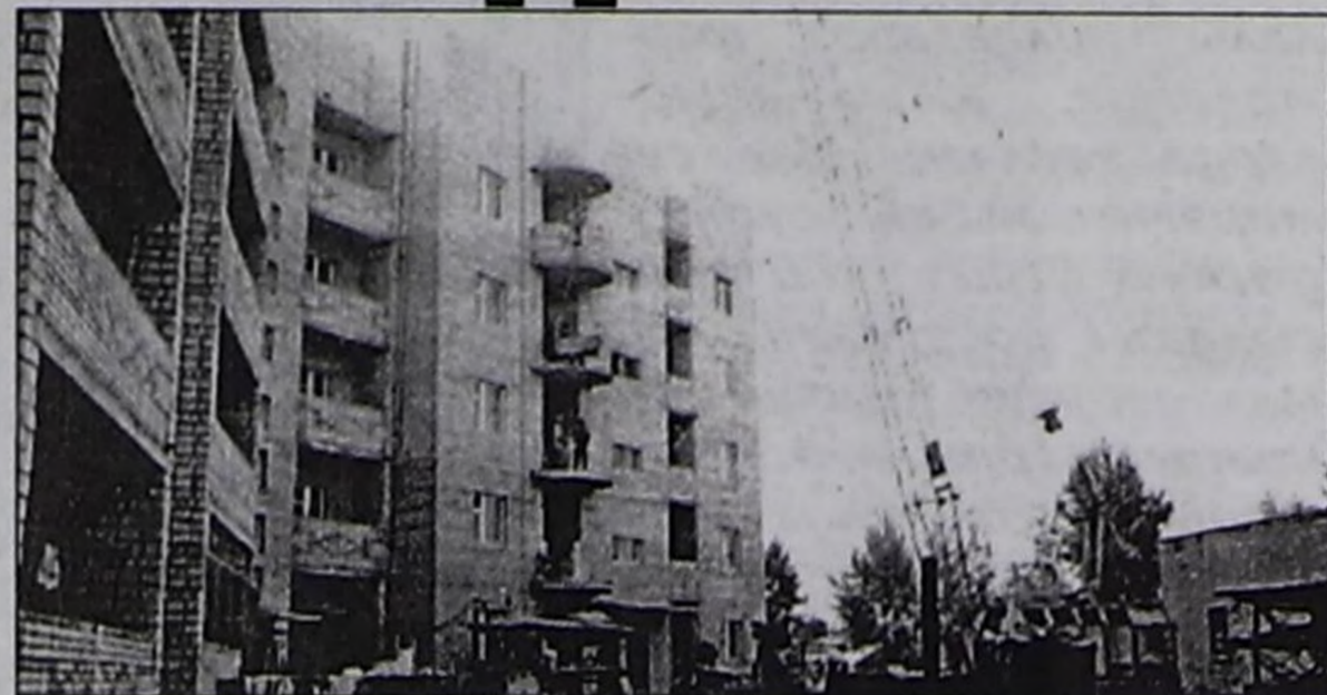
Айыыл чок чоруктуң федералдыг албанының Тывада эргелелиниң чуртталга бажыңының ниити хевир.

Ол үеде ажылчыннарга ажыл тып алыры кончук берге айтырыгы-ла болгай. Чижек кылдыр ап көөрге, чурт-шинчилел музейиниң тудуун бис кылып эгеледивис, ол 1995 чыл турган чүве. Акшаландырышкын айтырыгы үзүлгенинден ара каар ужурга таварыштывыс. Тендер (конкурс) езугаар ойнап алган еске тудуг организациязы кылып тур. Хоорайга кылып тудуг тывылбайн баарга, Тандының Элегеске школа тудуун-даа кылып турдувус. Шынын чугаалаар мен, үе чеже-даа берге турган болза, бистин тудуг организациязы ажыл чок олурбаан.