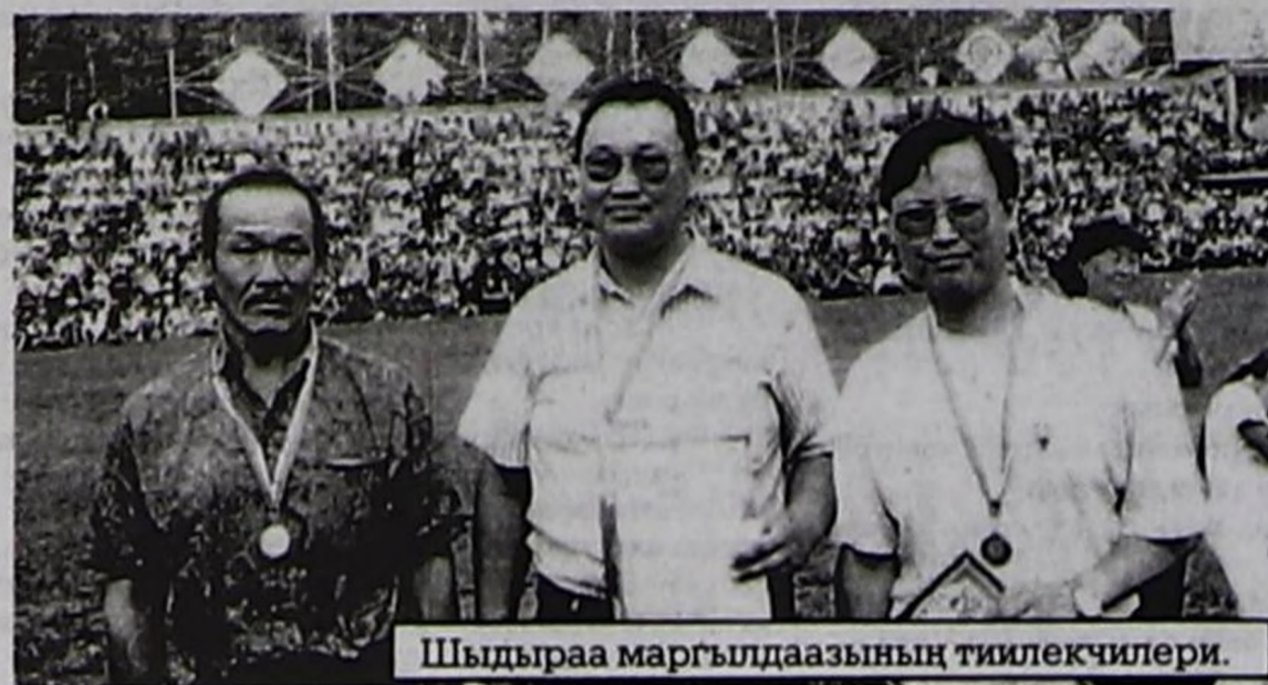
Шыдыраа маргылдааның тилекчилери.