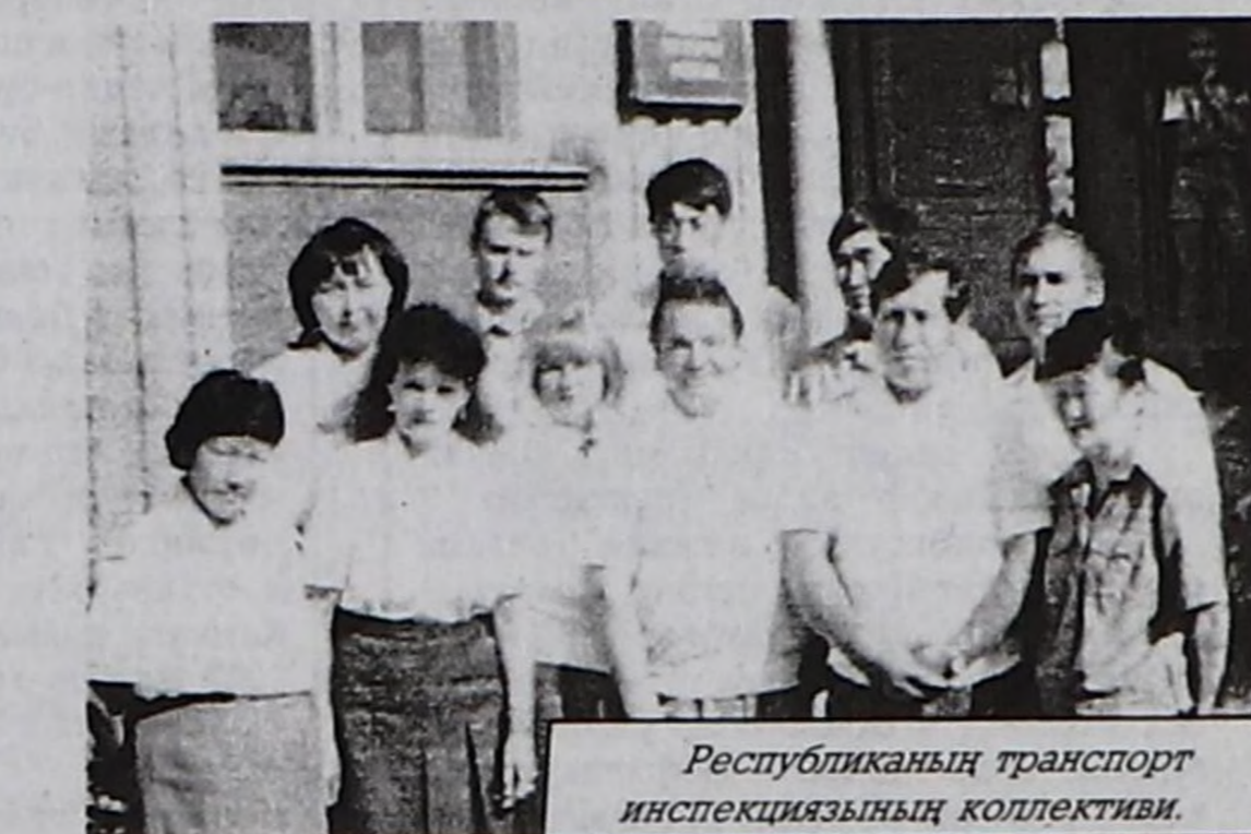
Республиканың транспорт инспекциязының коллективи.

лика биле Тыва Республиканың аразында даштыкы садыг харылзааны калбартыр сорулга-биле "Хандагайты" каайлы пунктузунга немештир чоокта чаа "Цаган-Тологой", "Шарасуур" каайлы пунктуларын ажылдалга кириген. Ынчап кээрге Тываның каайлы пунктуларын таварыштыр ортумаа-биле 300 тонна чүк эртери билдинип турар. Республиканың транспорт комплекстеринге күрүнениң транспорт контролюнун ажыл-чорудулгасын чорударда бистиң транспорт инспекциязы күрүнениң өске контроль органнары-биле кады чорудуп турар. Оларга ТР-ниң Бойдус курлавырларының яамызы, республиканың өрт кезээ, Тывада күрүнениң үндүрүг инспекциязы, санэпидхайгаарал албаны, ОШАЧКИ, каайлы албаны болгаш өске-даа черлер хамаарып турар. Ылаңгыя бистер-биле ИХЯ-ның ОШАЧКИ, күрүнениң үндүрүг инспекциязы, федералдыг үндүрүг полициязының