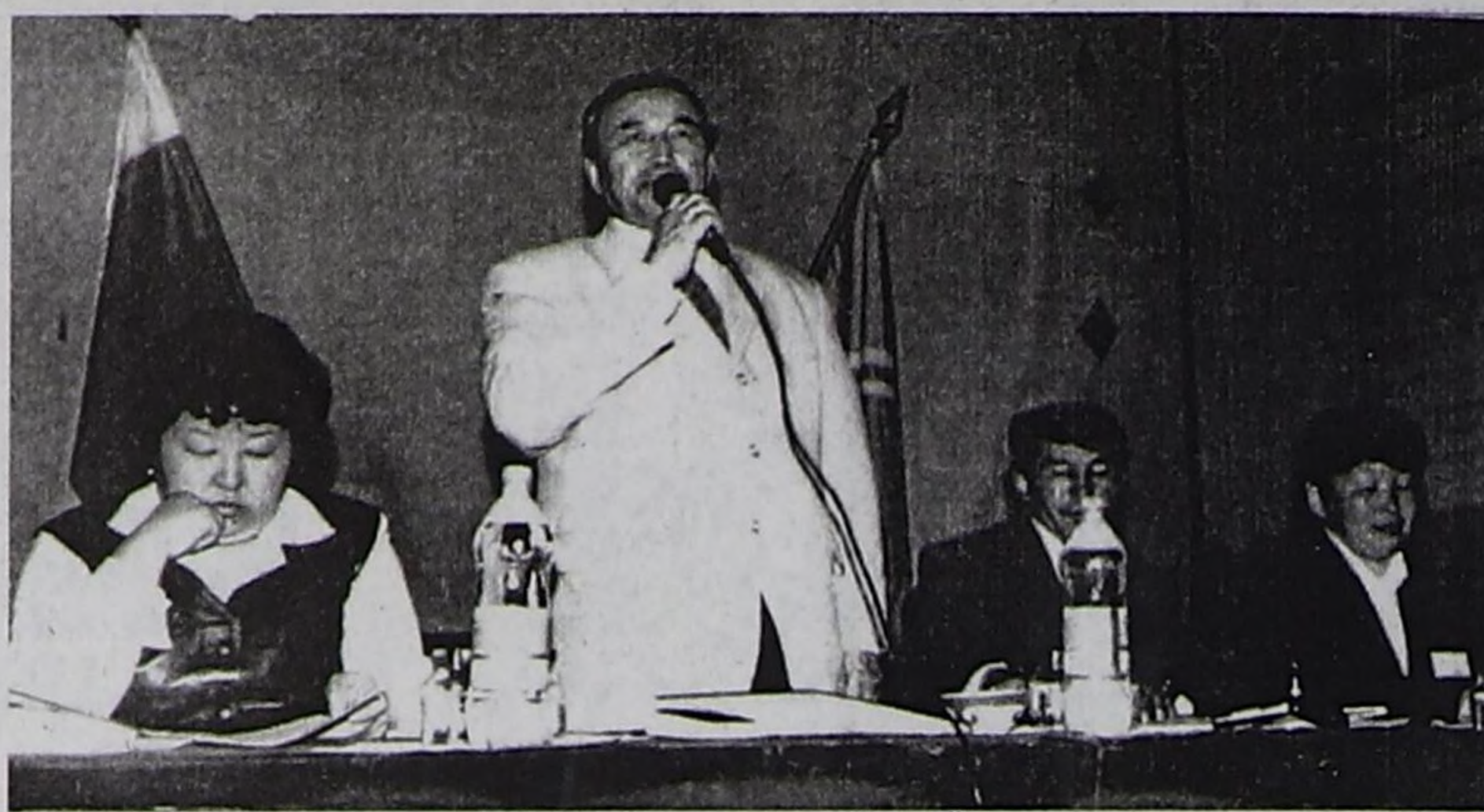
ЧУРУКТА: хурал үезинде.

ТР-ниң Чазак Даргазы Ш.Д.Ооржакка сөс берген. Эрткен сонгулдаларда Чазак Даргазының албан-дужаалына сонгул, улуг идегелди көргүскени дээш Өөктүн болгаш Бий-Хемнин сонгукчуларына өөрүп четтиргенин ол илереткен. 1997 чылда сонгулда кампаниязының үезинде сонгукчуларнын чагырларын колдуунда шуптузун күөскектенин дыңнаткан. Бий-Хемнин социал-экономиказын хөгжүдер дээш Чазак хүн бүрү кичээнгеи салып келген, дуза, деткимчени суму, суур бүрүзүнге, Туран хоорайга чедиргениниң чижектери ол чугаалаш, Өк сумузуңун социал-экономиказын хөгжүдер