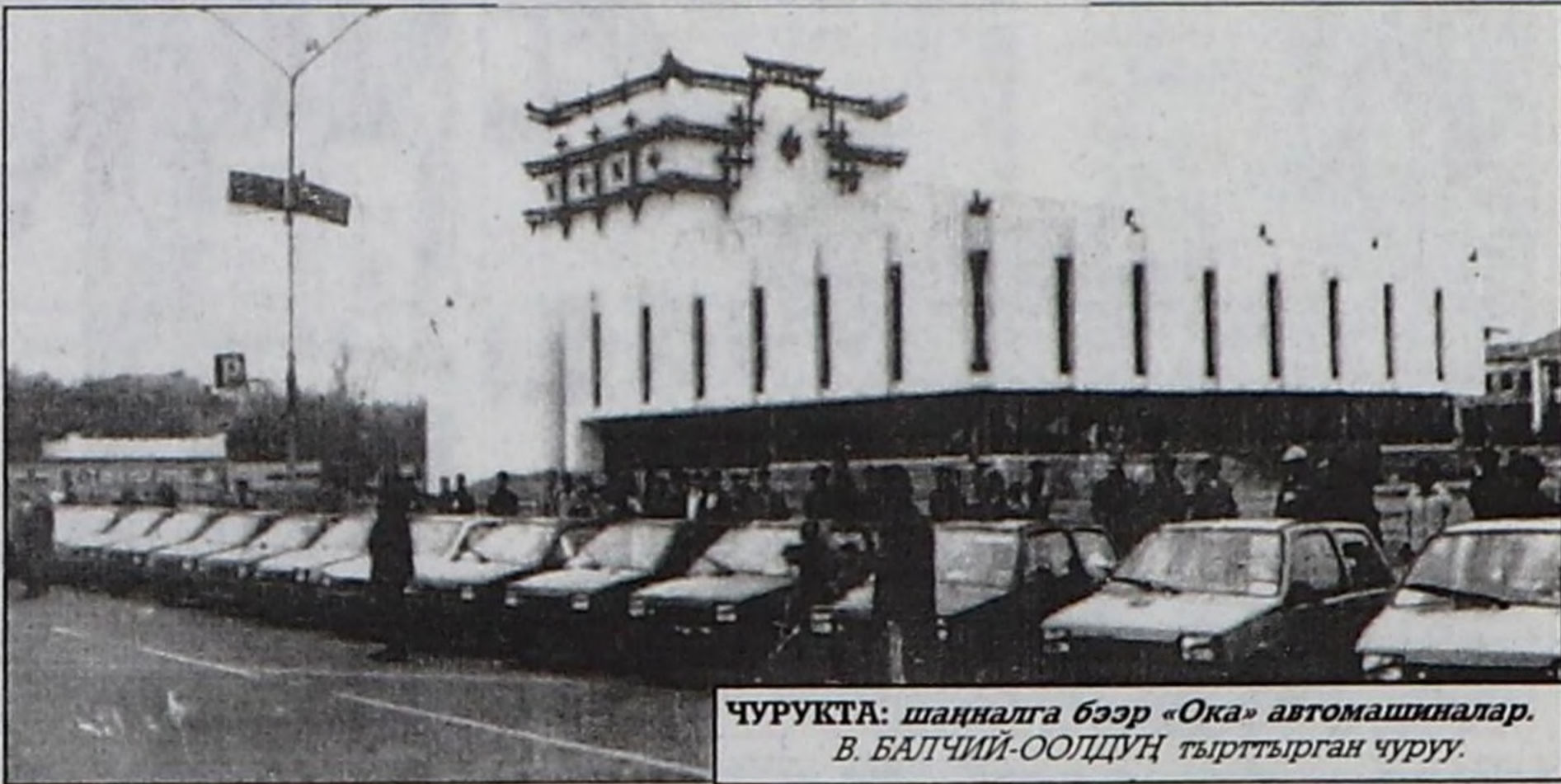
ЧУРУКТА: шаңналга бээр «Ока» автомашиналар.