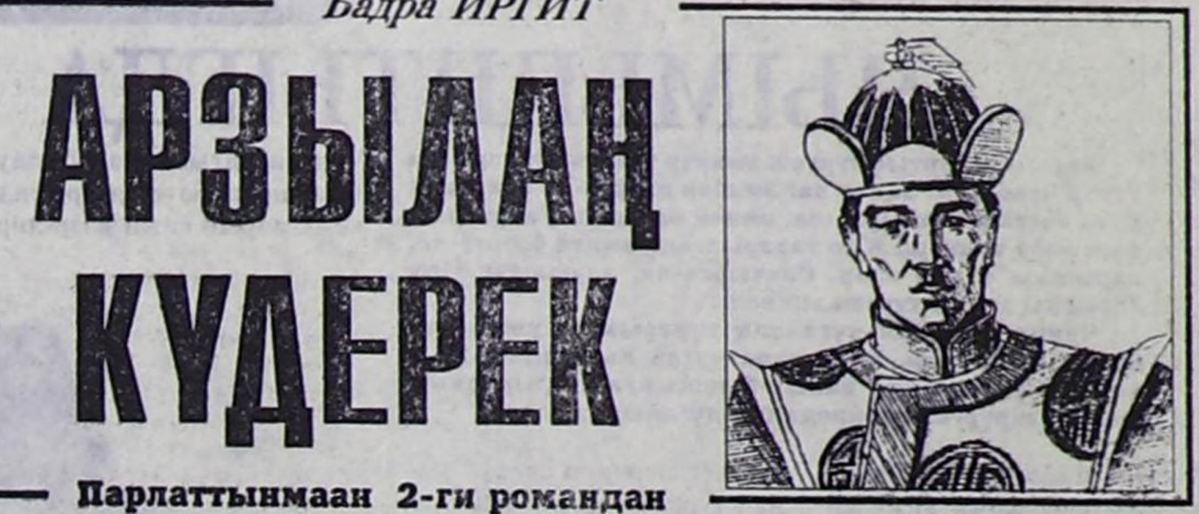
Парлаттынмаан 2-ти романдан

Нюра угбай караан чолуп, оожурга алгаш: — Оо, мээң сөзүм дыңнавалдыр, хайырааты... Че-че, хайырааты-даа дээр чүү боор. Оглум ышкаш оол ышкашыл силер. Кудай билеп, коруп турыйнаан. Аванар ышкаш калды-дыр мен. Камгаланып, дады чокка холдөп коруңер. Кижилерин сагымы — кузума! Силерге өш-өжөн сактыр адааржар, кандыг-даа кижилер таваржыр. Силерин дээш тейлеп олурар мен. Салган соорунар бедик, чагаай-дыр. Чүгө хооуун күзөл-биле херек кырында амыдырал — ийи аңгы. Ону ултапар, оглум! — дээш турган, Агбааның бажын камныг чыттап каан. Агбаан буянныг угбайнын мөңгүн билектеринг холун камныг алгаш, чыттап каан. Даштын чүгүртүг айт дуо-лары дагжак келгеш: — Че, кош белең тур. Чоруу-ла! — деп, орус кижинин тывалаан үнү дыңналган. Шутту тура халышканын.