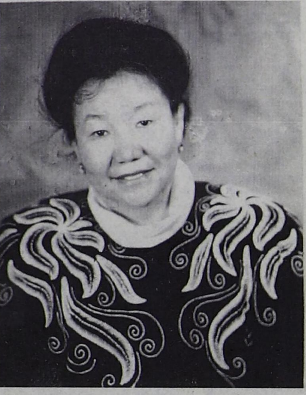
Аныяктары болгаш өгбелери аңгы, тускай бөлүккө хамаарыштыр апаар, чүге дээрге, кижи мергежил бедидеринин, ажыла тургустунарнын, хостуг үениң айтырглары-дыр.

тыва националдыг, дээди эртемниг, педагогика эртемнениң кандидаты. 1994-1996 чылдарда Москваның Аныяктар институтунун аспиранты. 1997-1999 чылдарда Москваның эргелеп-башкарылга күрүнесинин доктрантызы болушунан, РФ-тин Эртем болгаш технологиялар амызының Бүгү-Россия эртем-техниктиг төвүнүн девискээр болгаш национал политика талазы-биле директорунун дузалакчызына ажалдаан, а 1999 чылдан бээр — Москва хоорайның прокуратуразының эксперти.