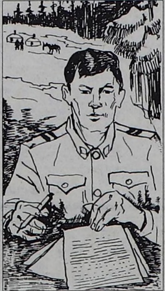
Авам "кижи чугаазы херек-севес" деп хыйланып чыдып калды. Кежээ удуп чыдып алдым.