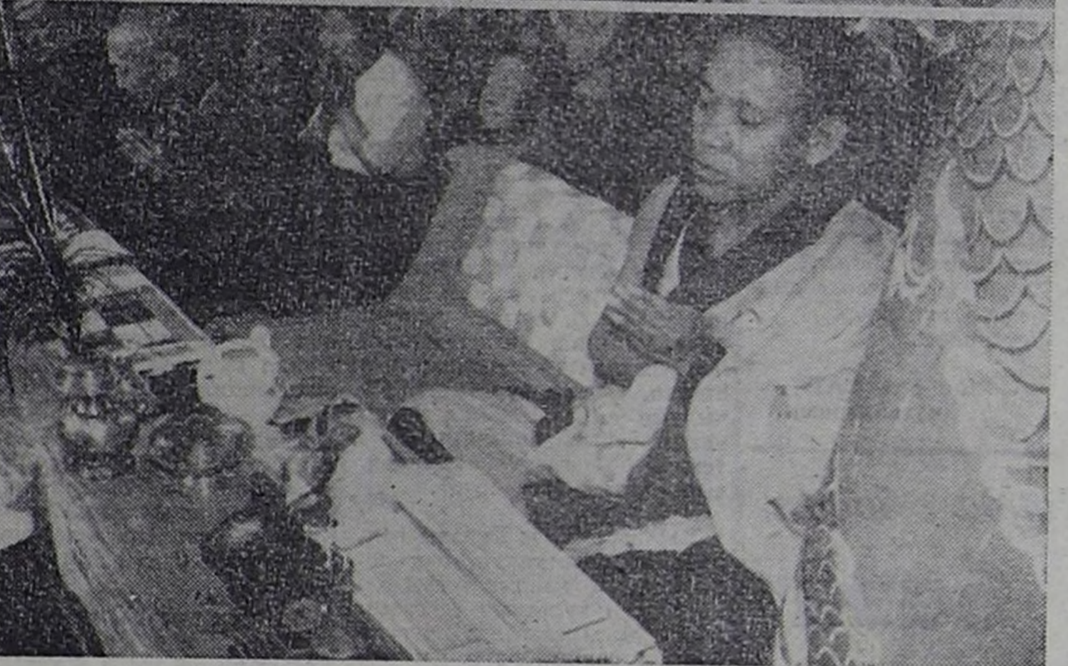
Тувтан Чойкорлинг хурээ. Ол Кызылдың он талачкы кижилер эвези эвес бооп чыдады.