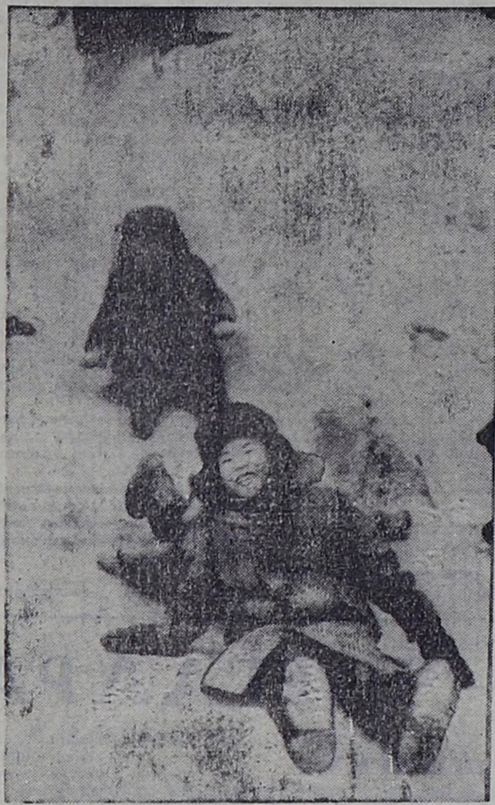
ЧУРУКТАРДА: Хоорай-жыгыштыг бижиктиң хаал-газы, чалаалыг тейле чүңү; хотлуг чунгулаашкын.

Дыштанылганы солун бол-дур дээш, чижээ, Кызыл хоорайнын чагыргазы Чаа чылдыг хар болгаш доштан бүткен хоорайжыгажы туду-дүп белеткээ. Наймыс-ла-дын чурттакчылары, аалчы-лары, ылангыш школячылар ону оюп эртейн турар.