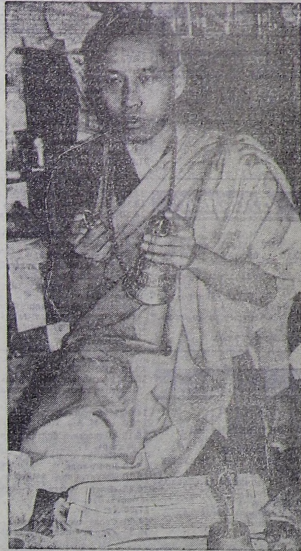
Башкы боду бөдүүн, сеткини биче, кижилерге дууларак, кичээгөйлеп, Оон-биле тапшырып, ижин-жара чокка чугаалашкан соонда, Ижин чөпчөрдү чагай чөпчөрү-ла бүүдүрчү чагай сеткил-сагышыне угламын күзөлдөп алар.