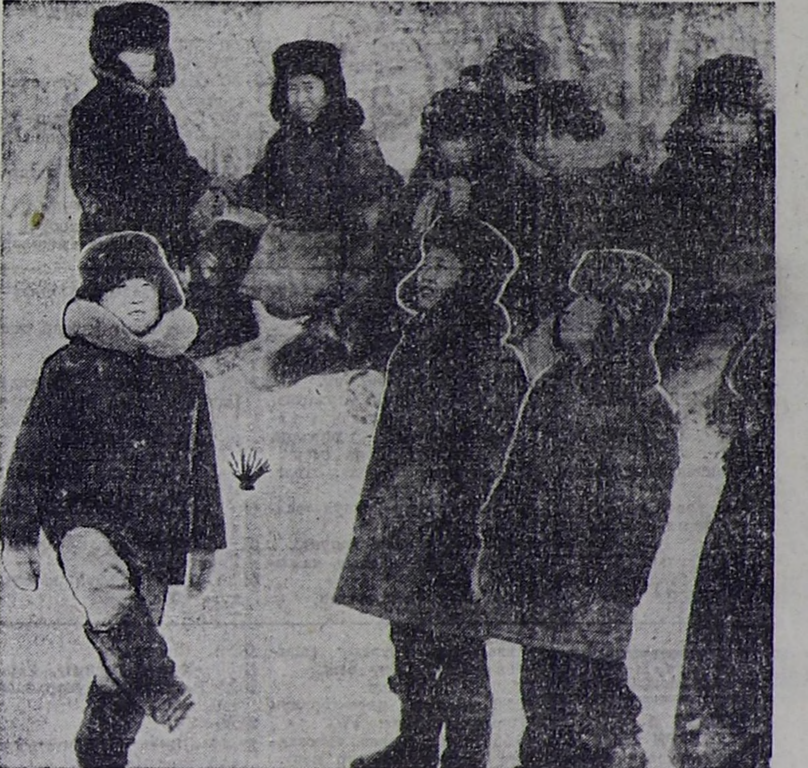
Василий БАЛЧЫН ООДУН «ТЕВЕКТЕЭН ООЛДАР» деп фототүзүл.

Катап, омааштан ижиң бо-лур. Редька оң ийди өткө, бүүрүңтерге даштар тыылдыр-базыңга ажыктың. Яб-локо халдың ханым дамыр-лаарың-быжылгаарыңга, эң ылаңды буттун дамыр аарыгыңга ууру болган ирра быжылгаарыңга дуулаар.