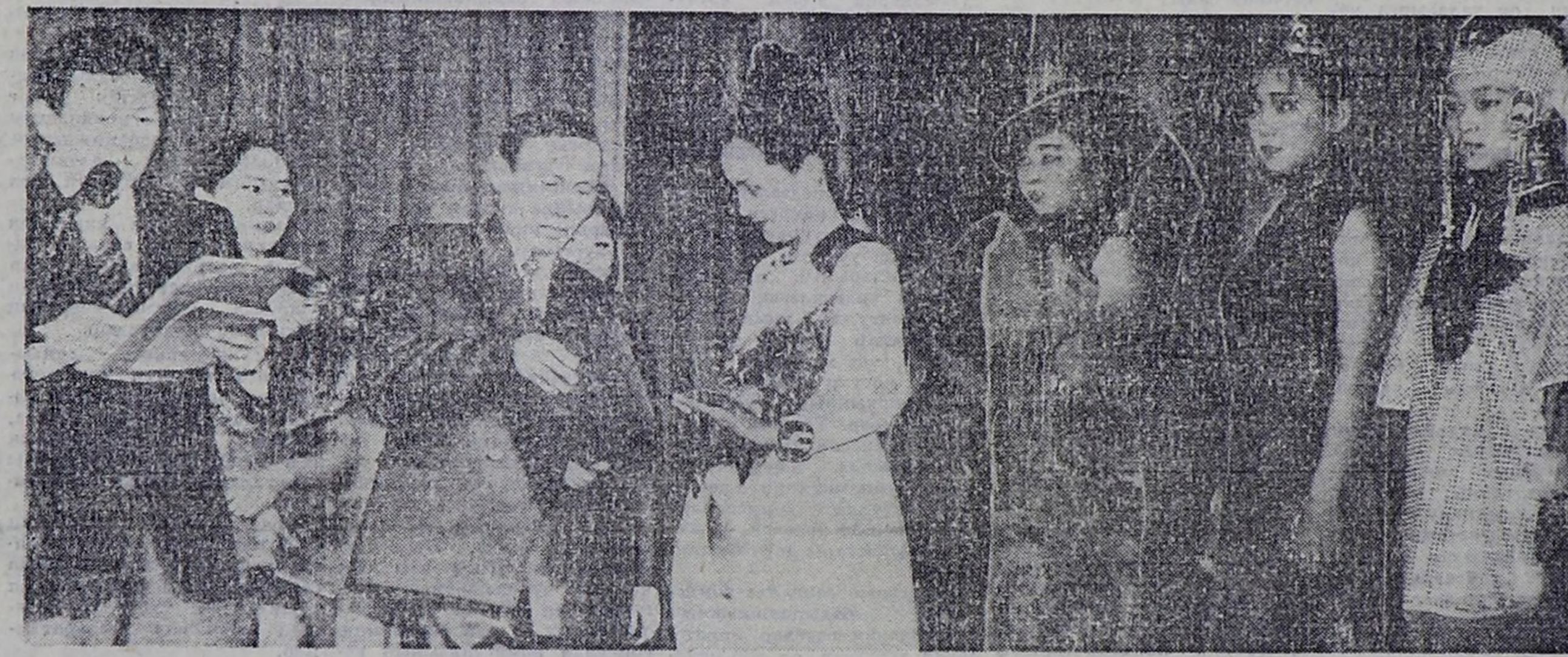
Өрлөр болган чаалаамыс суугуну Эргөвч-тир, ынакшыкар, мөгейнер, — деп киржикчилерин хей-адын көдүрүп турдулар.

Мөөрейин кол угланышкымы өгүлө, не-чашка хомаарышкан иштирилдеже хаара тудунган солганда, дагыналарга анаа хамаарыштыр ынак-бүрү айтырларын салган. Тыва хөрөө-жөн өртем ажылдакчыларының ат-сывын адаар-ары-баш ажаарда калдыг тыла өргөлөрүн ажылдап турган, өргөсч ажаарга калдыг чалбарылар чыга-лаарлы, канчаар нога э-рырыл, не кижини эргө-ажыны камгалаан калдыг хойлулар бары, суг бажын чүү дөш лагырыл «Хайыраан ботта» Караның ролон кымнар күөсө-көшүл дөш сон-да өске солдун ай-тырылгарын салып турду Чараш кыстарыстан чам дымзынга харылап, чам дымзынга харылавайын-до баарлары бар.