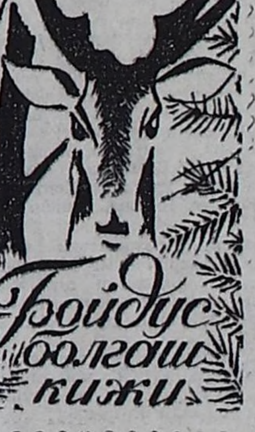
Бойдус болгон кижилер