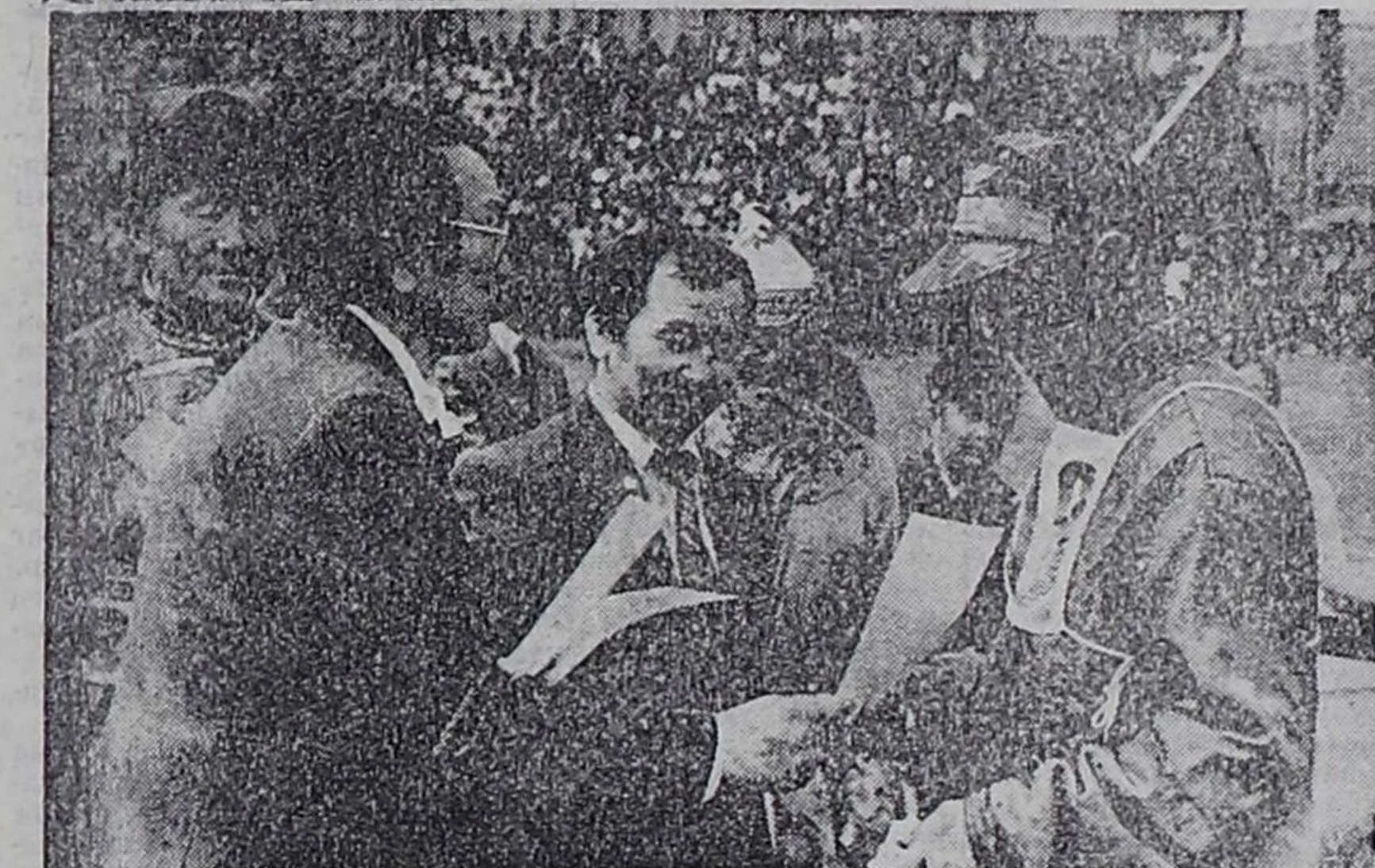
ЧУРУКТАРДА: Чааан спорт школарынын оренчилери Тилелтеиниң 50 чылдыгы тураскалган Чалаана—Кызыл арзынча чада-тергегин аянчорукту организастан.