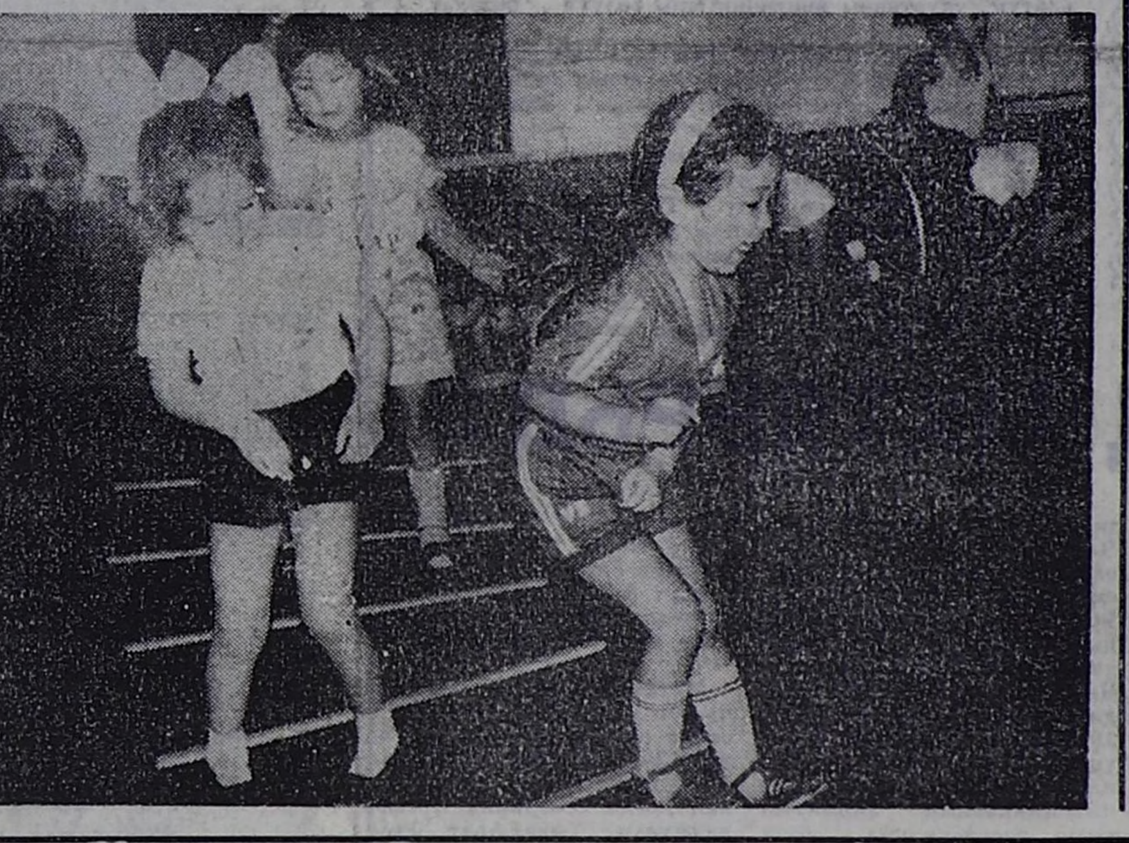
Чечена БАДЫ. ЧУРУКТА: «Кымга-даа алдыртпас мен...»

— Авай, авай! Бөгүн спорт байырлады болуп турду, бис конфеталар-биле шаңдаттыкыс. — Коргунчүг бөрүден кортпас дээр болза, спорт-биле байыралды болуу аа, ачай... Биске эң-не күштүг Карлсон, эң-не арыг-силги Мойдобыг аалдап кээп чорду... — Спорт калыңның ба-Ырлары дыка солун болду... Кызылдың № 21 уруглар садыңга кезеж, уругларның тарап чанар үезинде, бичи чаштар өткүт үнери-биле барык алгырып, уткуп келген ада-недеринге, үгбаларыңга, акыларыңга мынчаар хөөрөп турганың бо-ла дыңаап болду. Бо улудаа уругларның билери тоолдарыңың мадырларың киржилгези-биле эртенке спорт байырлалы база дыка солун болган. Оларда сезонунун эгелээш-биле бассейн ажылдыкшыңыңче далай, суглар хааны күндүг Нептун чалар. Оон сонда Чаа чыл, Март 8, Уруглар