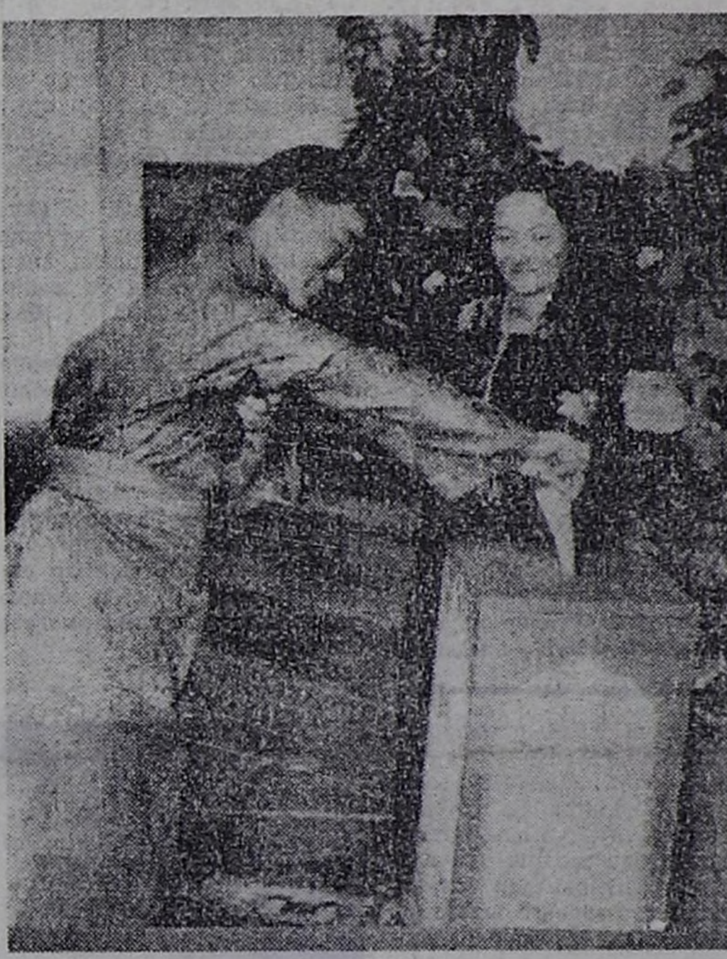
1945 чылдын апрель 29-та ССРЭ-нин Дээди Советинге болгаш РСФСР-нин Дээди Советинге Тыва автономнуг областан депутаттарынын баштайгы сонгулдалары бооп эртекш.

ЧУРУКТА: Кызыл хоорайнын сонгулда участоктарынын бирээзинде. Ала-чуртун Улуг дайыннын тулчушкун шөлдөринден келген тыва эки турачылар 1944 чылдын чайынында ээл кээп, оларнын хөй кезин тайбыч ажыл-ишче ымынгып кирипкеннер.