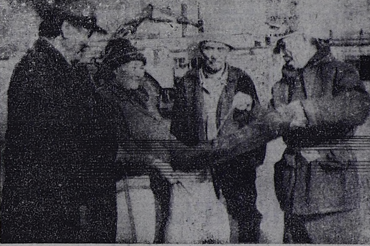
Ожемчон ОНДАРНЫН сөзү, чуруу.