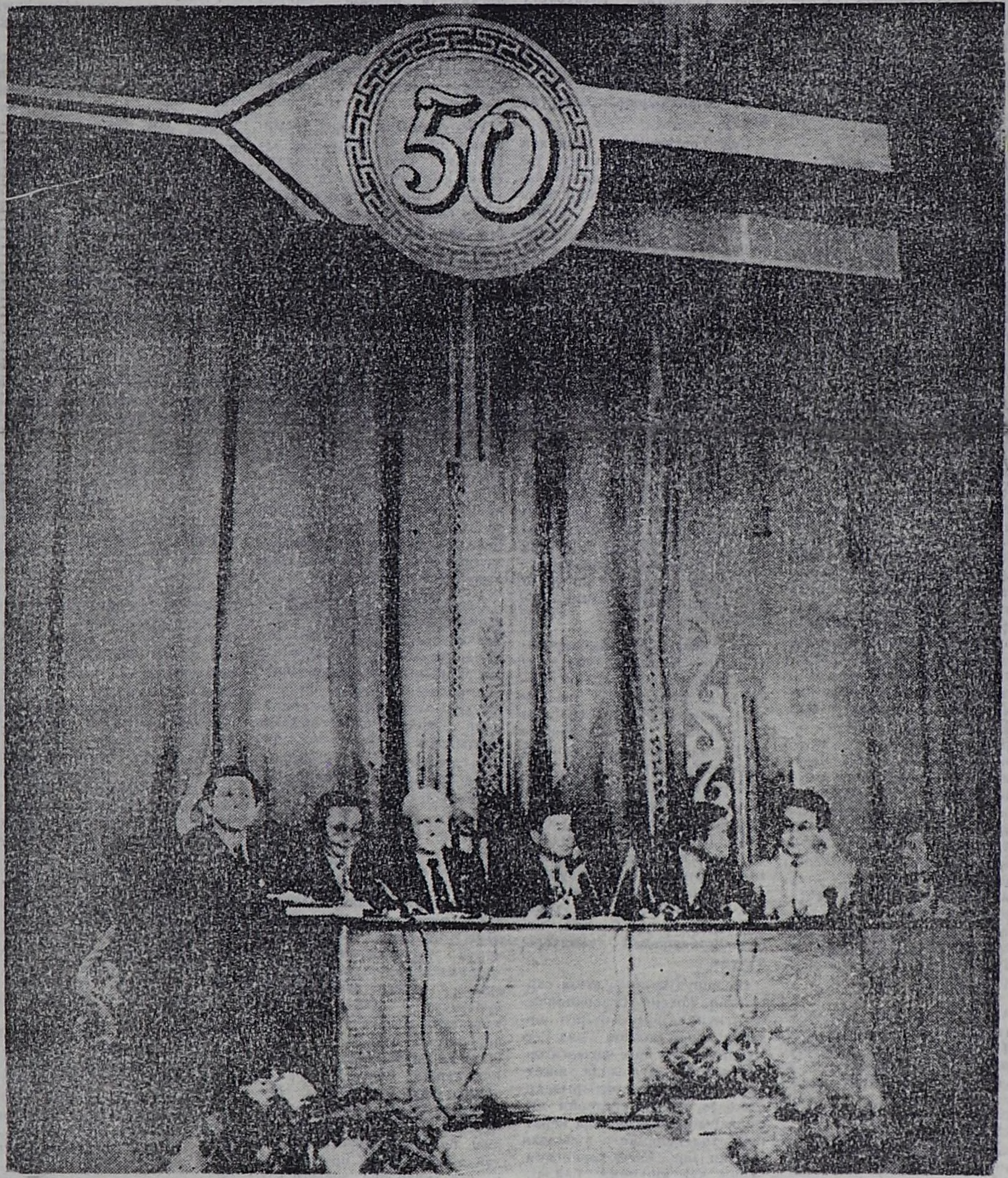
ЧУРУКТА: Байырлыг хуралдың президиумуна.