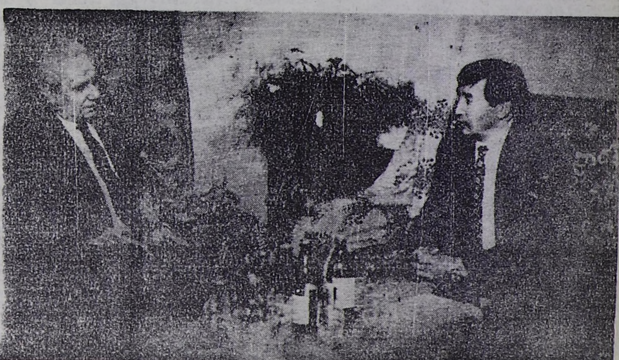
Россия Федерациязының Президентизиң Админи-страциязының удуртукчузу

С. А. Филатов биле Тыва Республиканың Президентизи Ш. Д. Ооржактың учураалы-га.