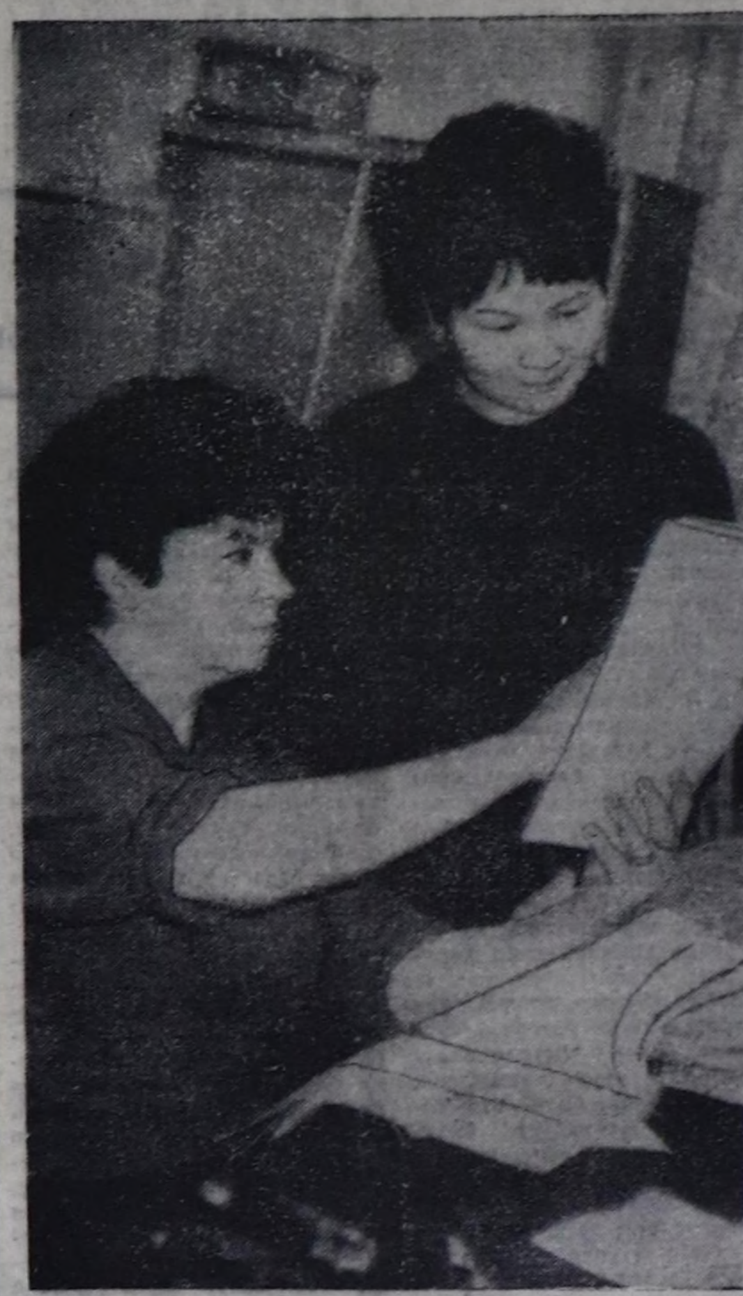
ТЫВА РЕСПУБЛИКАНЫҢ УЛУС ДЕПУТАТТАРЫНЫҢ СОҢГУЛДАРЫНЫҢ ТАЛАЗЫ-БИЛЕ ТӨП СОҢГУЛДА КОМИССИЯСЫНДА

«Тыва Республиканың улус депутаттарының соңгулдарының дугайында» Тыва Республиканың Хоойлузуңуң 54 чүүлүңе дүшүр Төп соңгулда комиссиясы 1993 чылдың апрель 11-де даразымча соңгулда округтарыңа үнүп чоруткан депутаттар орнуңа улус депутаттарың соңгулдарың эрттирериң доктаар-кан.